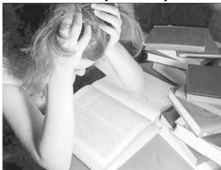
● До экзамена – одна ночь.

Ой, как кушать хочется! Время только час дня, а из школы раньше пяти часов не выберешься. Нервы сдают: сидишь и учишь физику до утра, чтобы, наконец, передать дурацкую теорию фотоэффекта, которую никогда не поймешь, ведь