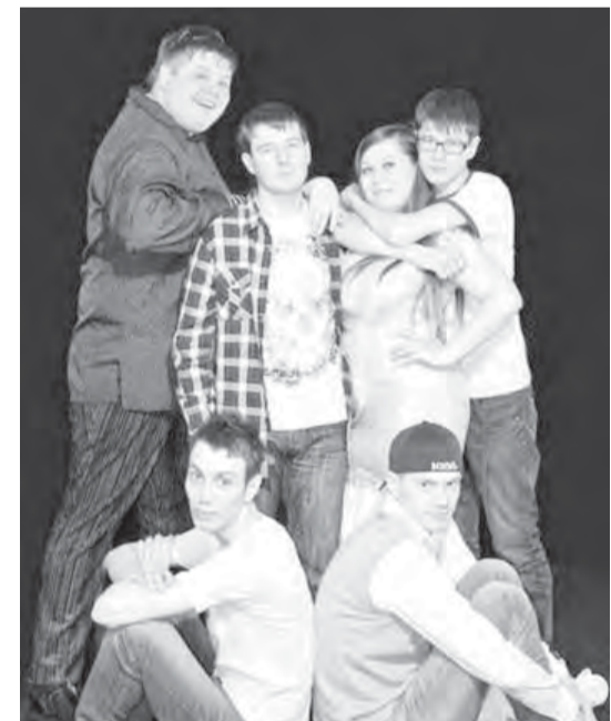
● Этих ребят магнитогорцы неоднократно могли видеть на городских праздниках.

Ребята из этой команды и других постараются сделать пять дней фестиваля наполненными незабываемыми событиями. Кроме того гости фестиваля смогут поучаствовать в мастер-классах известных российских аниматоров.