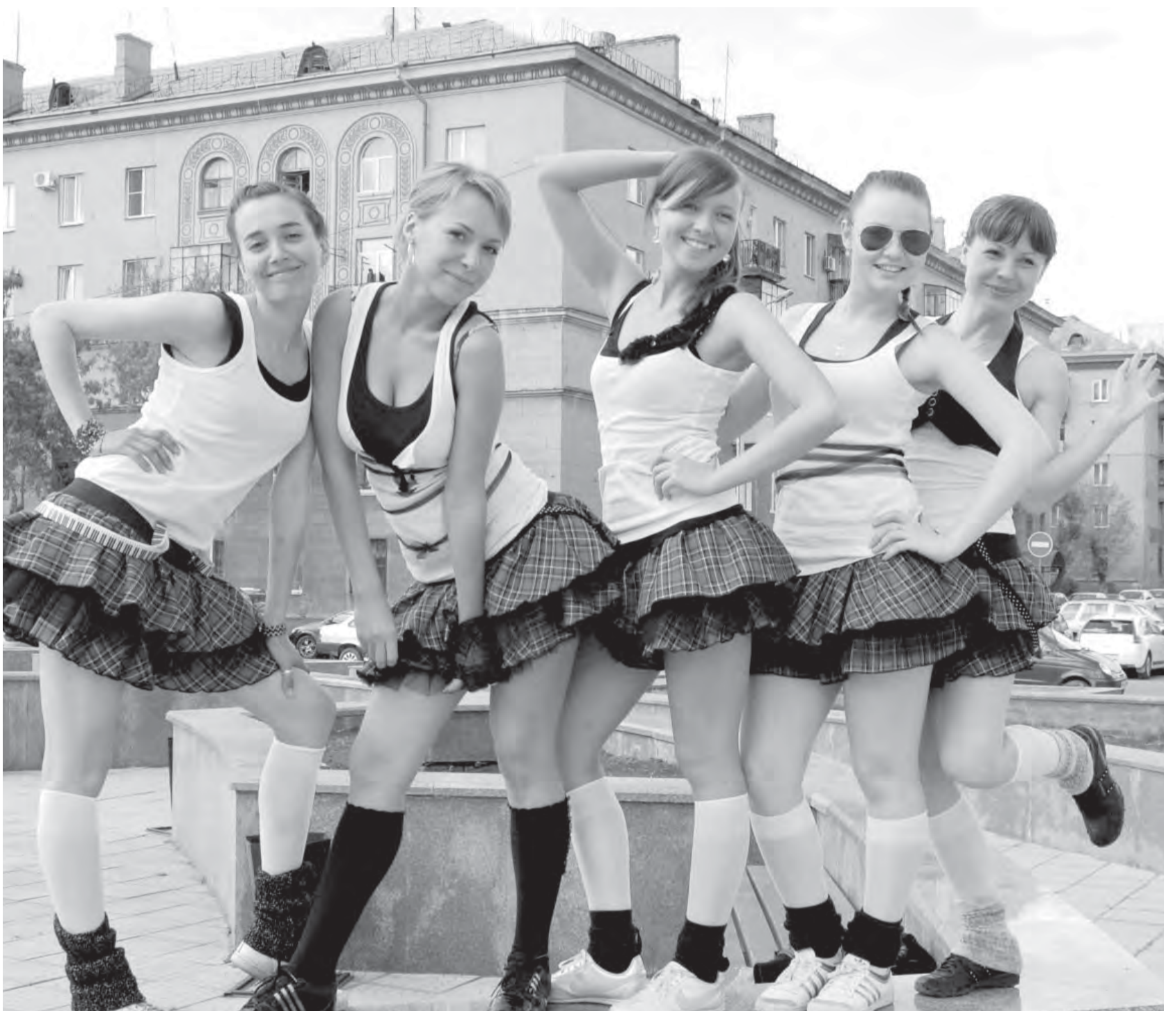
• Перед началом фитнес-марафона команды разминались под открытым небом.