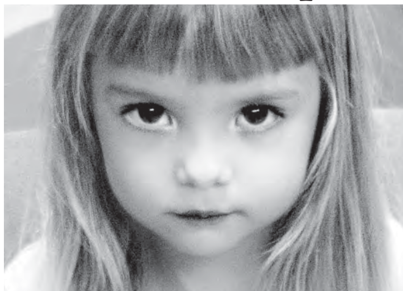
● Как спасти детей из неблагополучных семей, никто не знает...