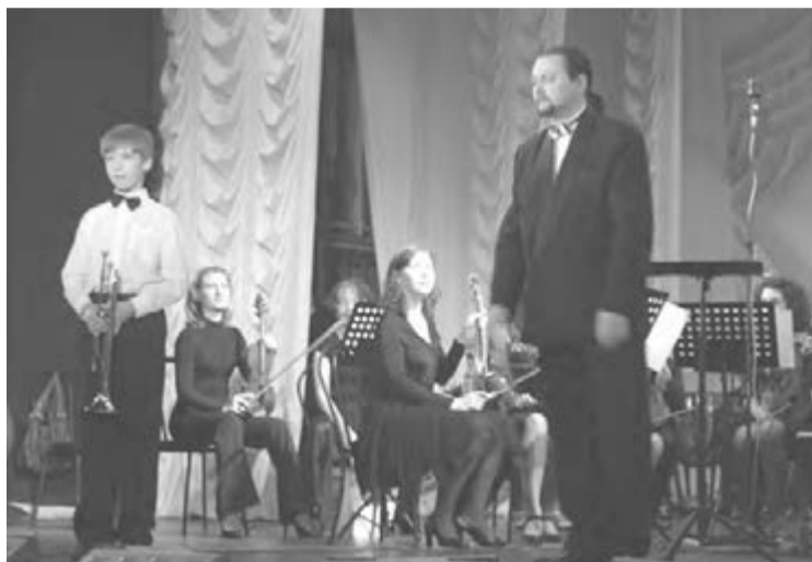
•Соло для трубы - с оркестром.

30 мая в 18 часов юные музыканты города выступят со взрослым симфоническим оркестром под управлением Сергея Приходько. Для подающих надежды исполнителей это, конечно же, будет своеобразный экзамен на аттестат зрелости. На оперной сцене покажут свои умения ученики школ искусств №1, 3,4, 6, 7, музыкального лицея, которые прошли через сито строгого отбора. Совет, состоящий из представителей управления культуры города и театра оперы и балета, отсеял около одной трети «конкурсантов». В результате осталось 13 номеров, достойных того, чтобы выступить в паре с симфоническим оркестром театра. Сольные партии на фортепиано, флейте, кларнете, скрипке в исполнении маленьких виртуозов предварт выступление «Соловухек Магнитки», которые и будут открывать этот часовой концерт исполнительского искусства. Пробившихся на