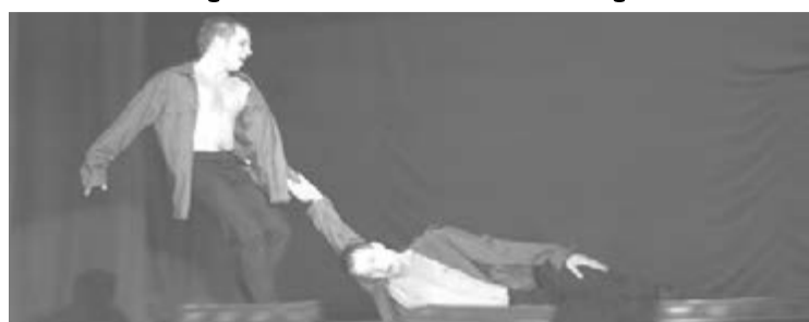
•На демонстрации боевых приемов.

В соревнованиях приняли участие более восьмидесяти спортсменов - мальчиков и девочек, юношей и девушек из Перми, Челябинска, Златоуста, Троицка, Каргалов, Магнитогорска, а также из близлежащих сельских поселений - Агаповки и Красной Башкирии. Всего было разыграно семнадцать комплектов наград в различных возрастных категориях и весовых группах.