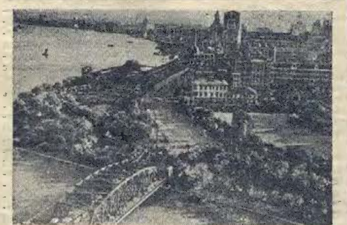
Китайская Народная Республика. Набережная в Шанхае.