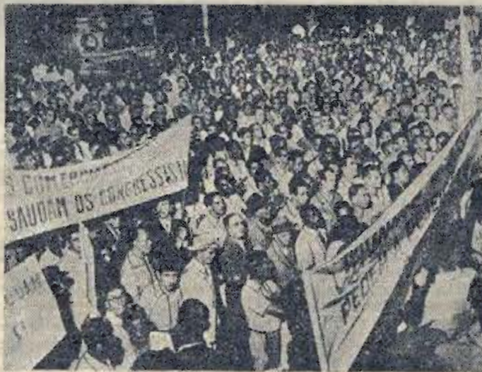
Народные массы Бразилии борются за улучшение жизненных условий. Недавно в столице страны Рио-де-Жанейро состоялась демонстрация против дороговизны. В ней приняли участие многочисленные народные, профсоюзные и женские организации. Другая мощная демонстрация, состоявшаяся в бразильской столице, требовала отменить запрет президента Кафе Фильо, который наложен на законопроект о предоставлении пенсий лицам, проработавшим 35 лет. В этой демонстрации приняли участие многочисленные делегаты из Сан-Пауло, Пернамбуко и других штатов. На снимке: демонстранты в Рио-де-Жанейро.

В связи с достижением соглашения забастовка прекращена. 28 марта. (ТАСС)