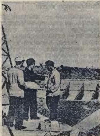
Корейская Народно-Демократическая Республика. В Анжун ведется строительство ирригационной системы. С ее помощью будет орошено 25.000 гектаров посевов риса. На снимке: составители проекта за работой на месте ирригационного строительства.

Лондон, 24 марта. (ТАСС). Изношенное оборудование многих фабрик, заводов и шахт Англии, а также низкий уровень техники безопасности являются причинами частых несчастных случаев. По сообщению журнала «Уорлд Ньюс», ежегодно в Англии происходит примерно 700.000 несчастных случаев на производстве, из них 250.000 — в угольных шахтах. В результате несчастных случаев на производстве ежегодно гибнет 800-1.000 заводских рабочих и около 700 горняков.