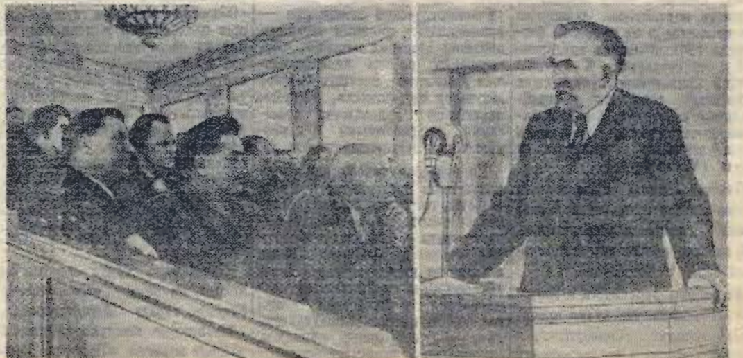
На снимке: в зале заседаний. На трибуне — академик И. П. Бардин.