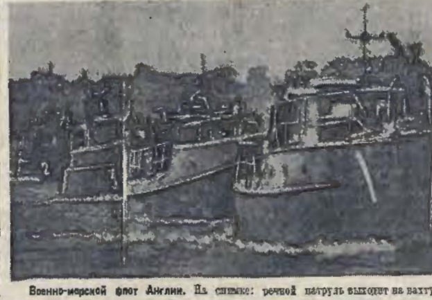
Военно-морской флот Англии. На снимке: речной патруль выходит на вахту.

По окончании — художественная часть. Исполнил Сталинского райсовета.