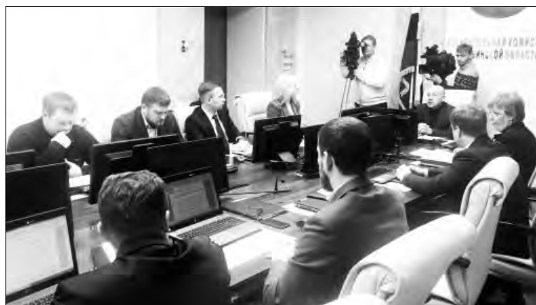
Подготовка к выборам идёт полным ходом

Также председатель рассказал членам избирательной комиссии о получении 2704319 специальных марок.