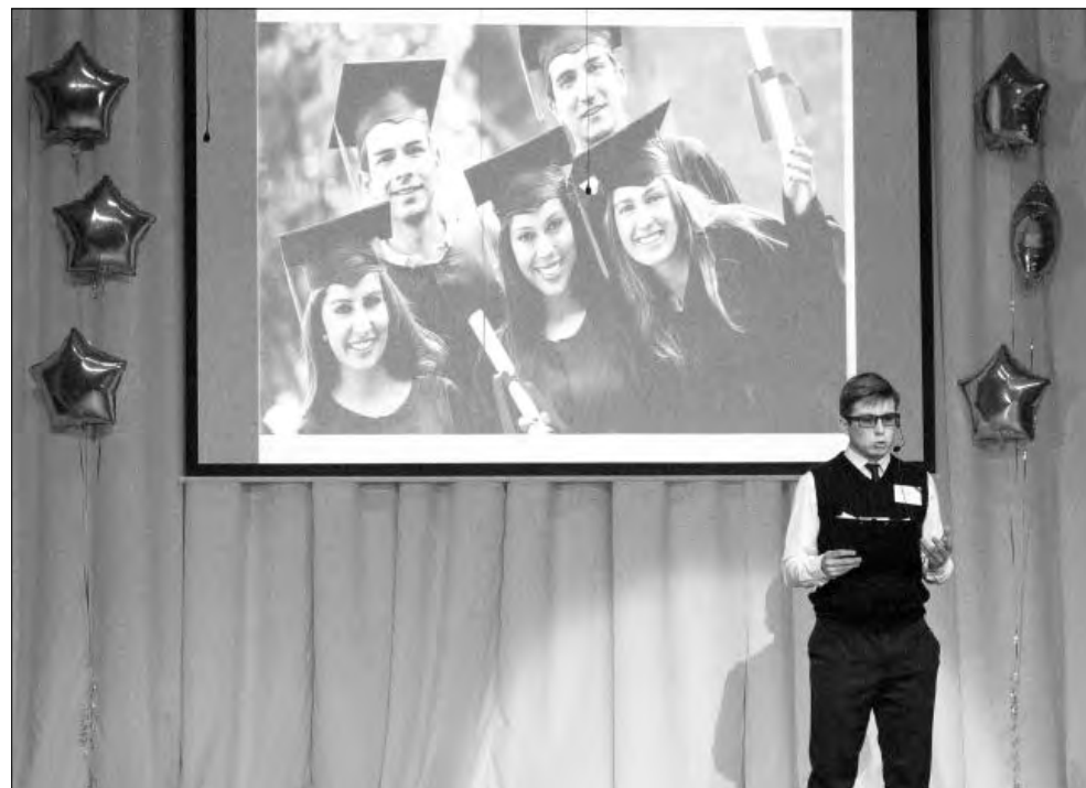
На сцене Правобережного центра дополнительного образования блистал цвет ученичества Магнитки

Участниками конкурса «Ученик года» становятся отличники и активисты, люди интересные и увлечённые