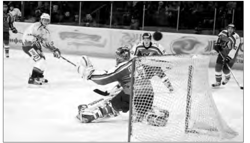
Выигрывать сегодня «Металлургу» сложно, но надо

У Мэтта ЭЛЛИСОНА, также приглашенного на роль лидера, дела идут лучше. Он играет много и чаще полезно. Особенно хорошо нападающий выглядел с легионе-