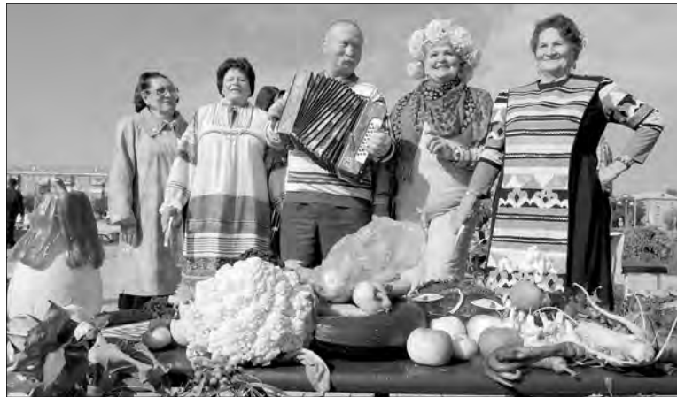
Старшее поколение умеет радоваться жизни