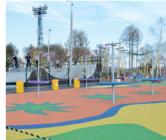
Парк у Вечного огня