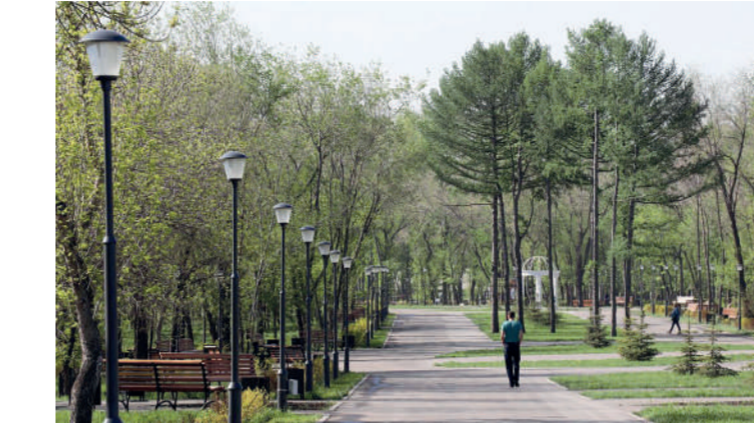
Парк у Вечного огня

Заканчивается проектирование термального комплекса. Уже в октябре 2024 года начнутся строительные работы. Комплекс общей площадью 6000 квадратных метров, с четырьмя уличными подогреваемыми бассейнами, два из которых – с так называемым «выплывом» из помещения на улицу, будет расположен около гостиницы «Европа». Для комфортного перемещения по локациям предусмотрен теплый переход из гостиницы. Расчетная посещаемость объекта – 1200 человек в день. Комплекс будет включать 11 различных видов саун по температурному режиму и отделке: хамам с отделкой потолка в виде звездного неба, арома-сауна для парений с добавлением ароматических масел, сауна впечатлений, где проходит сеанс парения с эффектом грозы и тумана, звуками леса и дождя, а также гималайская сауна из кедра со вставками панелей из натуральной гималайской розовой соли. Панорамные бани на дровах и русские бани будут представлены как отдельно стоящие строения с собственной небольшой благоустроенной территорией, чанами с горячей водой и купельями. Также комплекс будет включать бассейны крытого и открытого типа с комфортны-