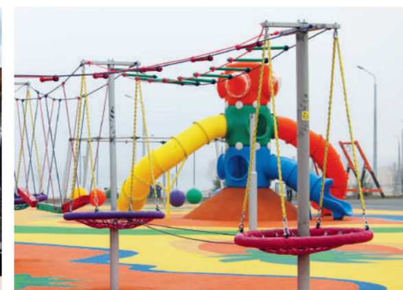
Парк у Вечного огня