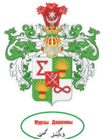
Родовой герб дворян мурз Дашкиных Утвержденный Дворянским Собором 17 Октября 2014 года