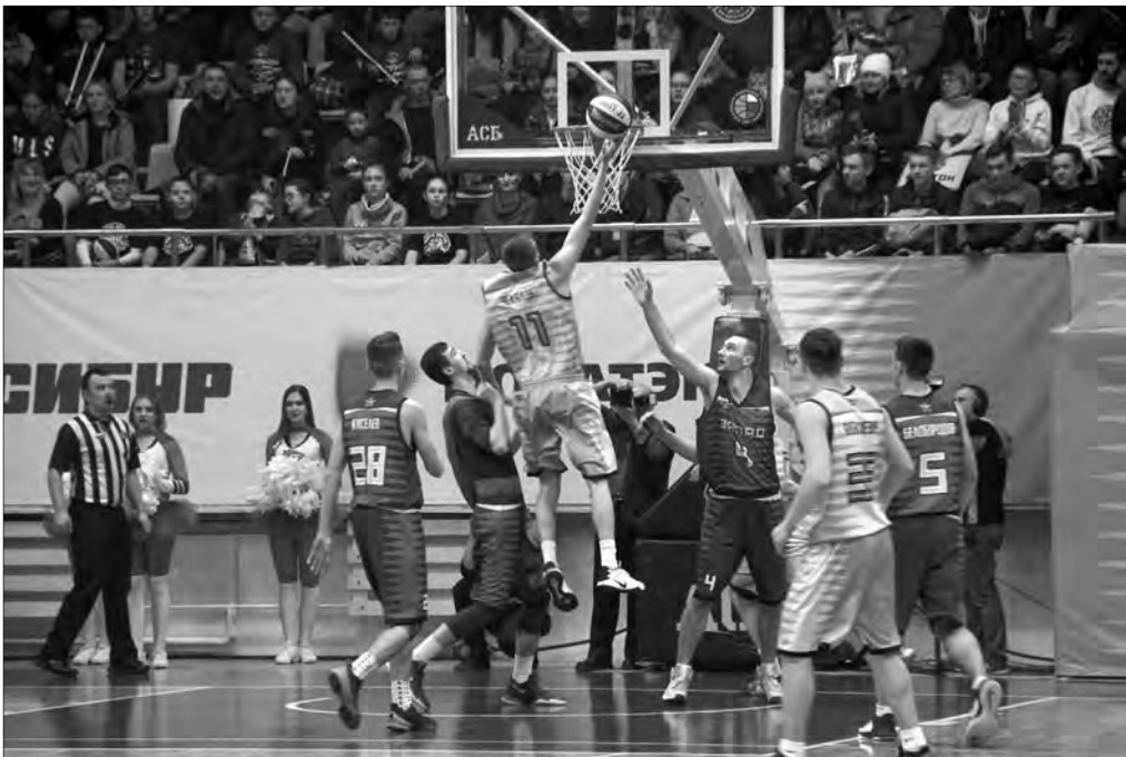
Матч звёзд порадовал всех