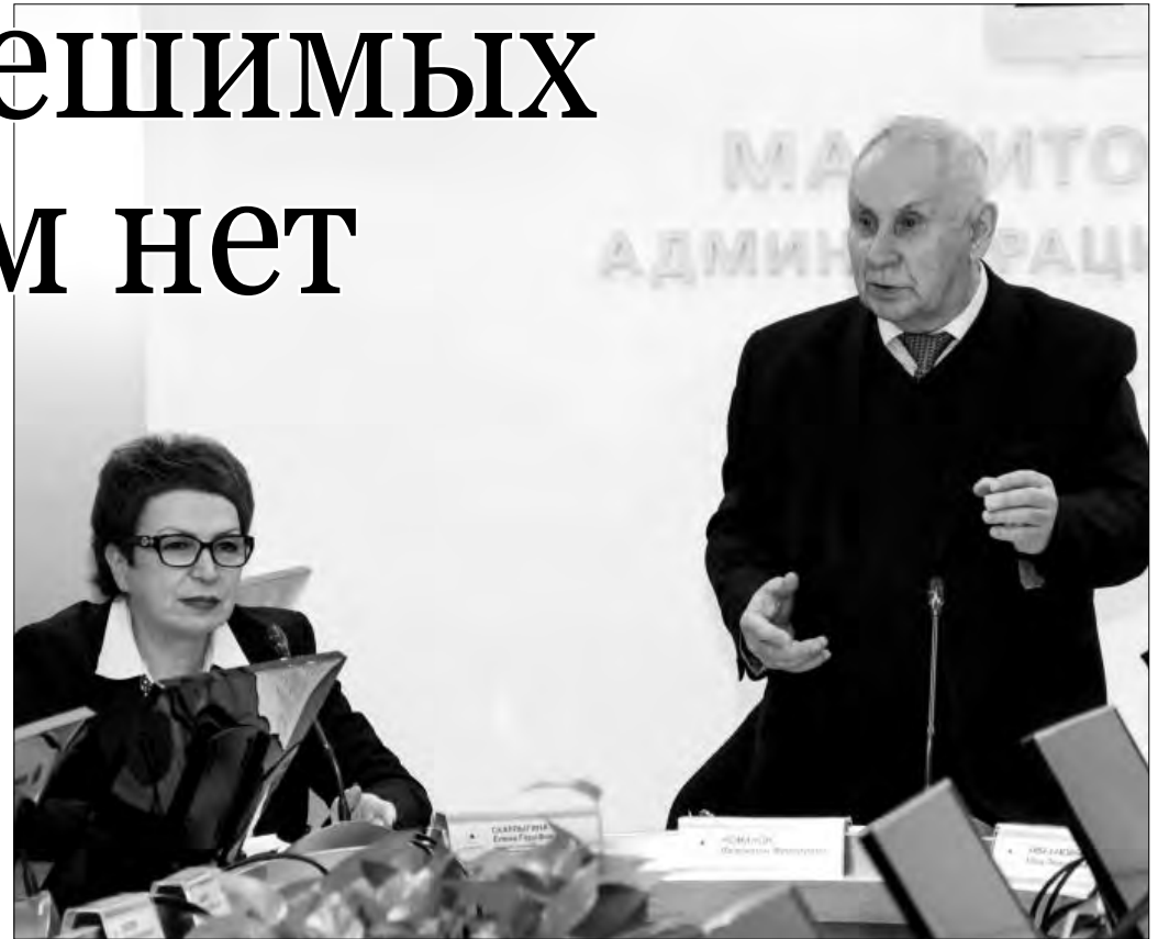
Общественники живо интересовались ситуацией в ЖКХ

Однако даже в этих условиях работа по модернизации инфраструктуры продолжается. Так, на 2018 год выделены 400 тысяч рублей на реализацию мероприятий по программе «Чистая вода». Вынос хозфекального коллектора с