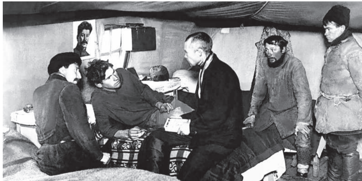
«В палатке первостроителей Магнитки» / ФОТО: МАКСА АЛЬПЕРТА, НАЧАЛА 1930-Х ГОДОВ

«Первой палатке» был присвоен статус памятника регио-