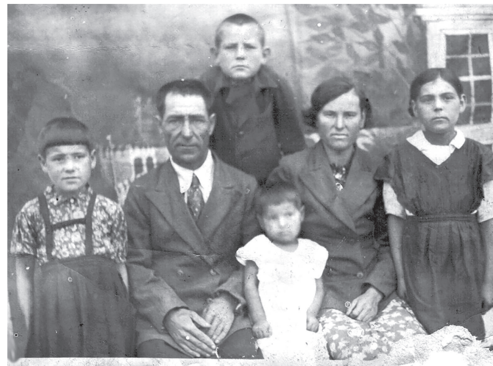
Лето 1941 г., перед отправкой на фронт /