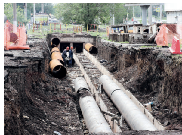
«Новая Труда»

– Какие ремонтные работы идут этим летом? – Ремонтируем запорную арматуру и сети. Капиталь-