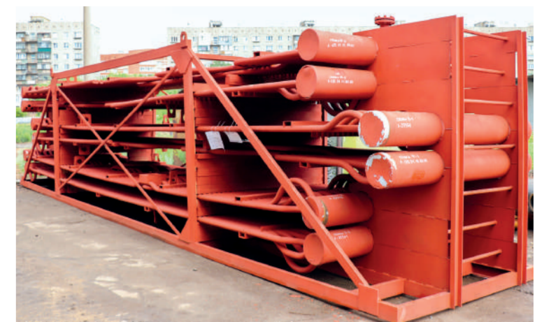
Начинка нового котла /

плекс мероприятий, какие-то летом, другие круглый год. Например, ряд скважин Верхне-Кизильского водозабора характеризуются высоким уровнем железа и марганца. Мы провели большой объем работ по уменьшению процента потерь питьевой воды. Это регулирование сетей, их зонирование, работы по перекладке и капитальному ремонту сетей. И нам фактически в полтора раза удалось снизить уровень добычи. Благодаря этому несколько лет назад полностью вывели из эксплуатации эти скважины. И вода, которую подает Верхне-Кизильский водозабор, соответствует всем нормам и по железу, и по марганцу.