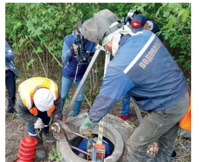
У колодца на 12 участке /