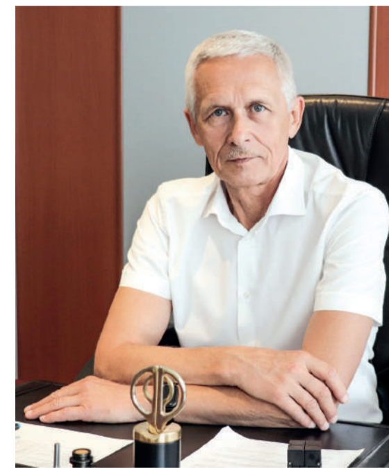
Тепла много не бывает