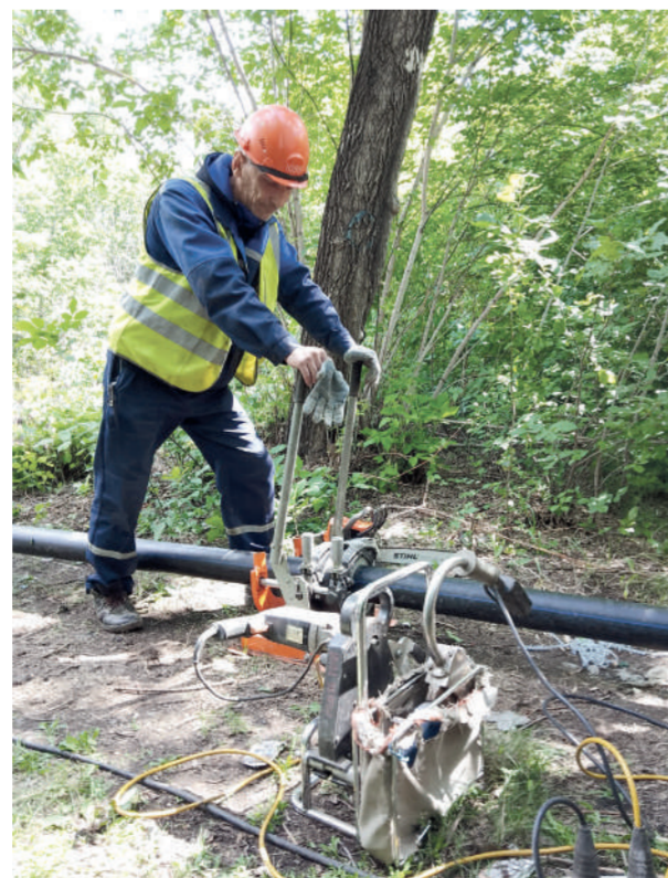
Сварка пластиковых труб /

ный ремонт прошел на улице Уральской, полностью поменяли трубы диаметром 250–300 миллиметров, также поменяли участок трубы в проспекте Ленина. Проводятся работы на теплотрассе на улице Суворова, она идет по раздельной полосе над землей. Меняем старую изоляцию на полиуретановую в металлической оцинкованной оболочке. Заменяли арматуру в узловых колодцах, чтобы была возможность выполнять переключения на тепловых сетях даже в отопительный период. Это плановая работа по повышению надежности теплоснабжения и эффективности действия тепловых сетей. В рамках инвестиционной программы переходим на новые материалы. Четвертый год укладываем высокотемпературные полиэтиленовые трубы, армированные кевларовой нитью. Меняем стальные трубы на полиэтиленовые на сетях горячего водоснабжения и даже сетях отопления. В районе «кольца» – это 75, 80, 81 кварталы – построят большую группу домов с хорошим благоустройством, и мы будем туда прокладывать такие трубы. В этом году начнем там работать в августе. 75 квартал сделали в прошлом году, в этом половину 80-го сделаем. И года на два эту работу планируем.