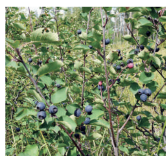
Ирга лесная /