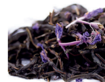
Чай из кипрея ферментированный /