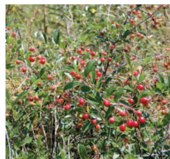
Степная вишня /