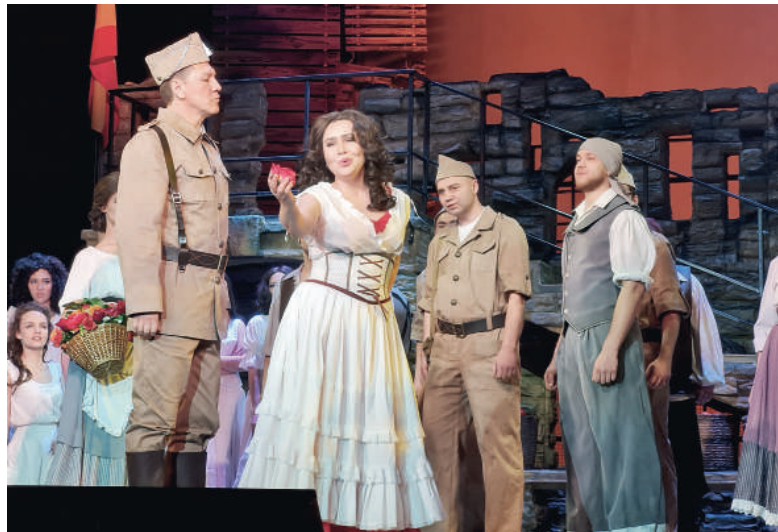
ФОТО: ЕЛЕНА ПАВЕЛИНА «МР»

Вива опера 2023. В этот раз фестиваль подарил возможность увидеть блистательную «Кармен» Жоржа Бизе и трогательную историю «Травиаты» Джузеппе Верди