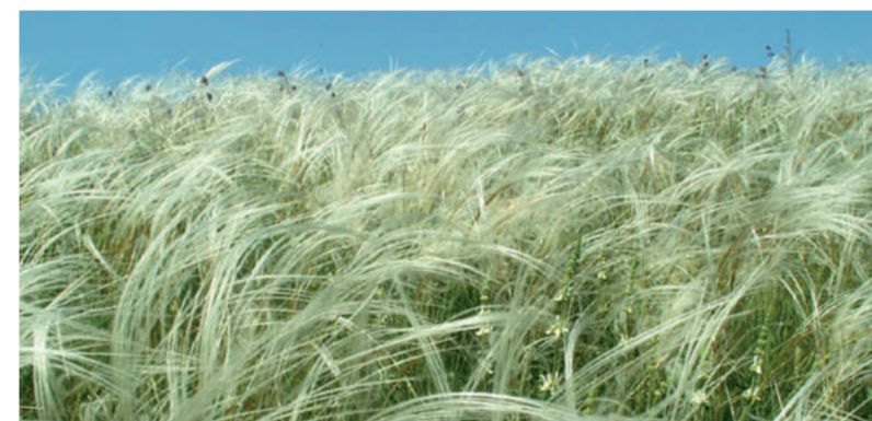
Ковыль перистый /