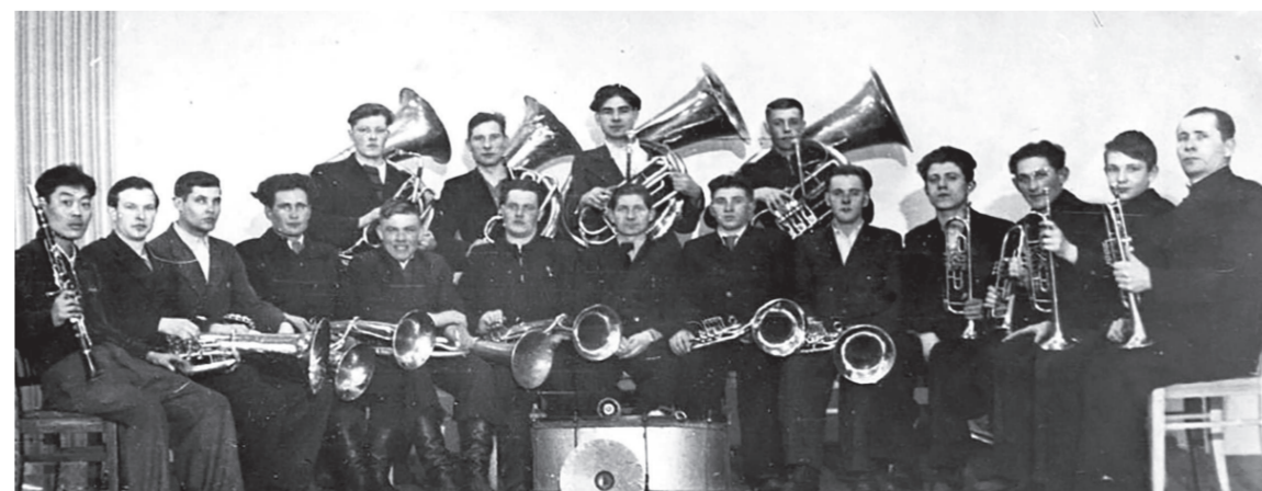
Духовой оркестр Центрального клуба строителей

В учреждении работали детский и взрослый драмкружок, где ставили пьесы Горького, хор, татаро-башкирский коллектив, оркестры – духовой и народных инструментов. В