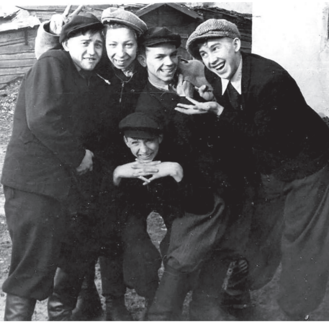
Ребята пятого участка

В учреждении работали детский и взрослый драмкружок, где ставили пьесы Горького, хор, татаро-башкирский коллектив, оркестры – духовой и народных инструментов. В