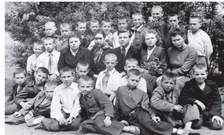
Школа №11, 4 класс, 1947 г.