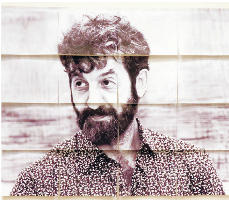
На выставке можно познакомиться и с цитатами из аккаунтов автора в соцсетях.

На выставке представлены работы художника нескольких последних лет. Экспозиция состоит из трех «эпизодов».