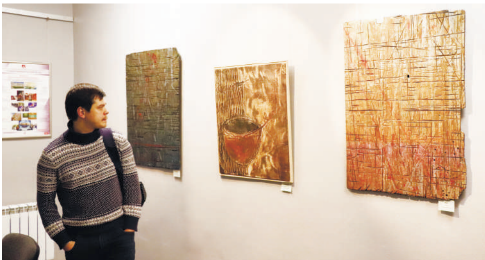
Работы художника непросты для восприятия.