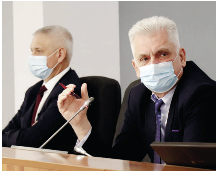
Заседание городского Собрания.