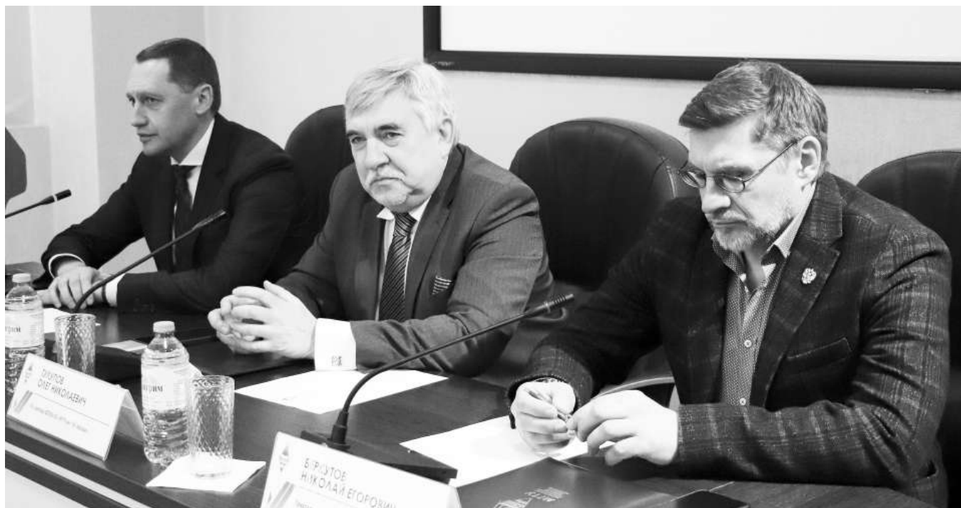
Что нам стоит дом построить? Нарисуем – будем жить. Сейчас это становится реальностью.