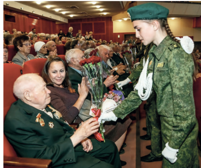
ФОТО: ПРЕДСТАВЛЕНО БФ «МЕТАЛЛУРГ»

К чему готовитесь сейчас? — Конечно, мы готовимся к 9 Мая. Четвертого мая организуем для ветеранов праздничные выступления в ДКМ Орджоникидзе, придут более девяносто человек, первые лица города будут поздравлять их с Днем Победы. Там же в середине мая соберем «Клуб почетных благотворителей», будем их благодарить, вручать креативные призы. Приурочим мероприятие ко Дню мецената РФ. Познакомим с нашими благополучателями, расскажем, какие результаты были достигнуты благодаря помощи благотворителей. Скажем «Спасибо!» всем благотворителям за помощь, которую они оказывают.