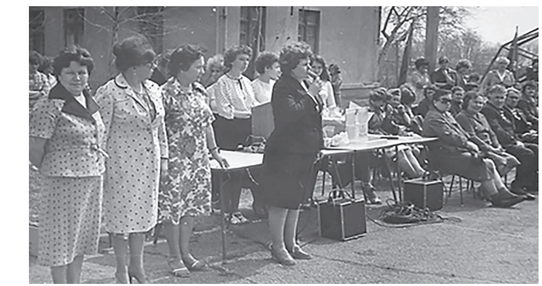
Будни дошкольного отделения /