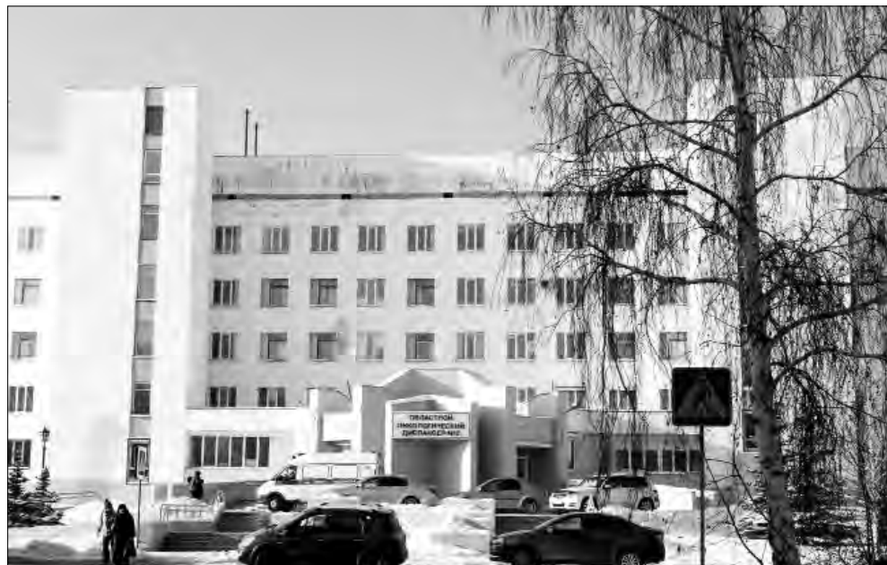
13 тысяч человек состоят сегодня на учёте в Магнитогорском онкодиспансере

Журналистам рассказали о новом методе 3-D планирования лучевой терапии. Теперь опухоль можно рассмотреть в объеме, что позволяет при диагностике нанести меньшее повреждение ткани, которая находится рядом. Для лечения пациентов успешно используется фотодинамическая терапия.