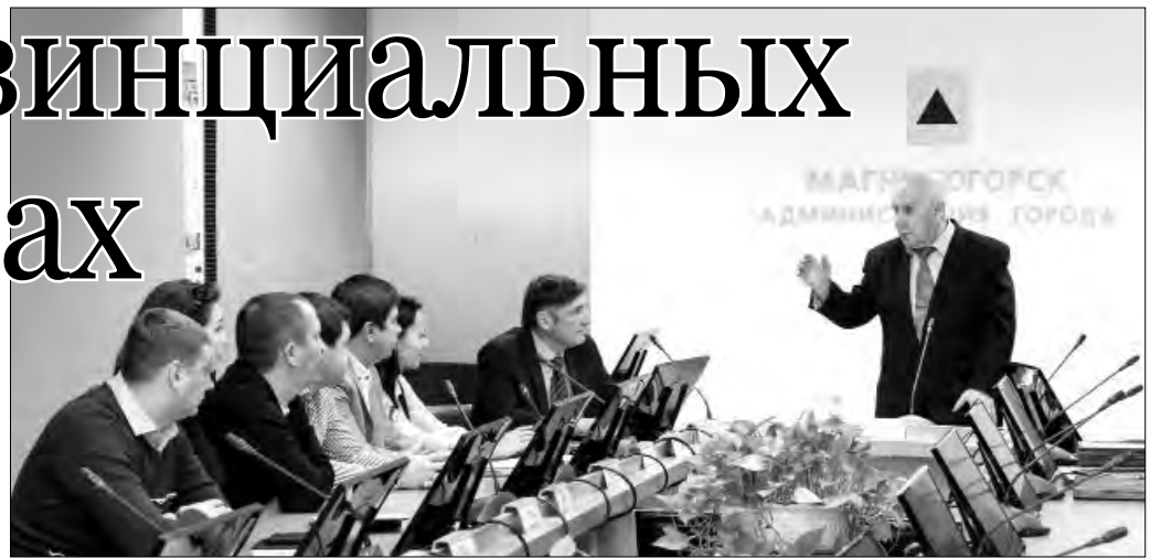
В Магнитке в массы несут отнюдь не массовую культуру

Уходящий год стал важным рубежом для Дома дружбы народов. На 26 декабря запланировано его торжественное открытие после не-