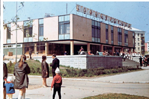
Здание театра «Буратино», 1972 год

текторов, являлась автором статей и докладов в журналах «Архитектура СССР» и «Советская архитектура».