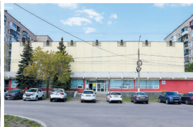
Картинная галерея / ФОТО: ДИНАРА ВОРОНЦОВА - МР-