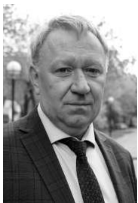
Сергей Абрамов

В Магнитогорске до начала июня в клумбы высадят более 620 тысяч цветов.