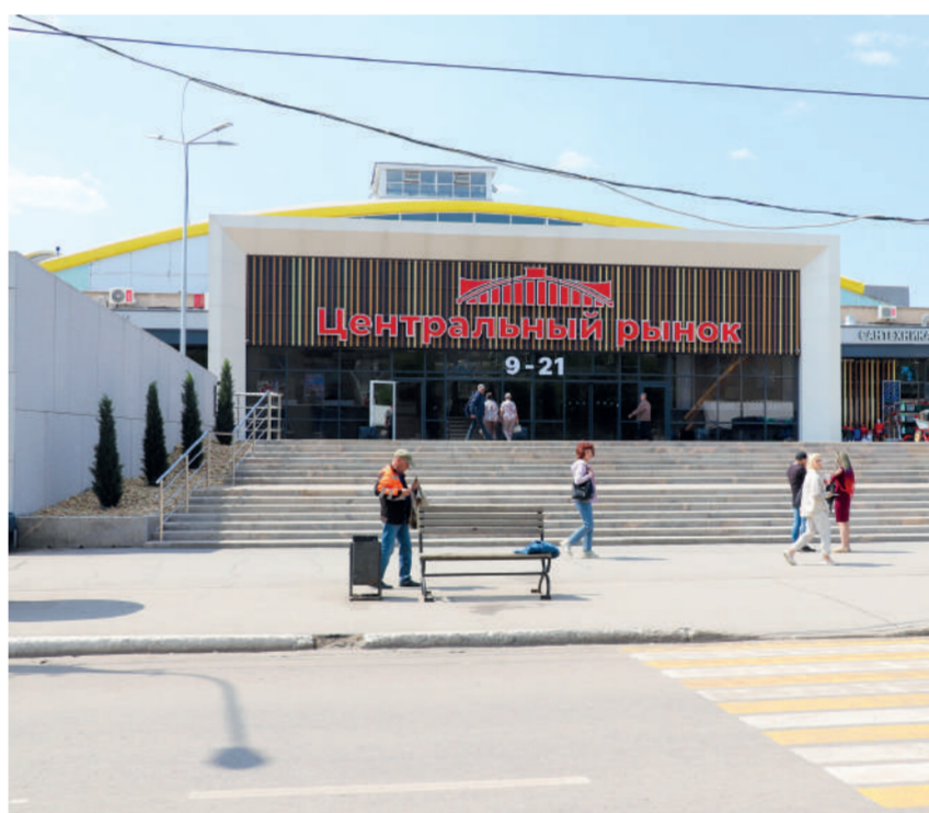
ФОТО: ДИНАРА ВОРОНЦОВА - МР-