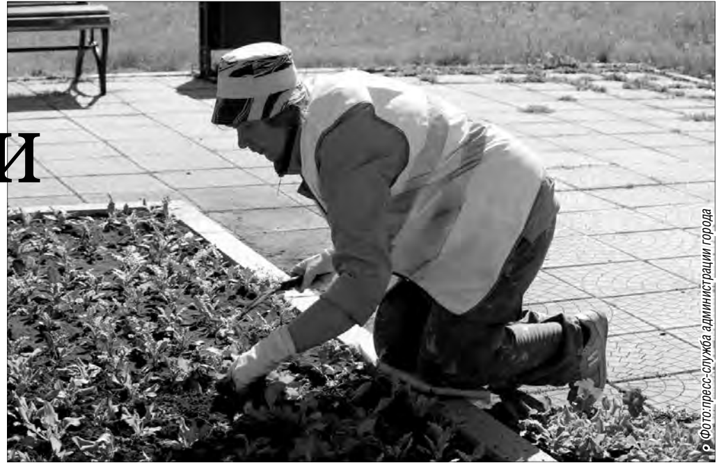
Озеленители кланяются каждому цветку

Поставщик определен с помощью аукциона. Так же, как и в прошлые годы, его выиграло предприятие из Волгограда. При перевозке ни одно растение не «выпадает», все посажены в