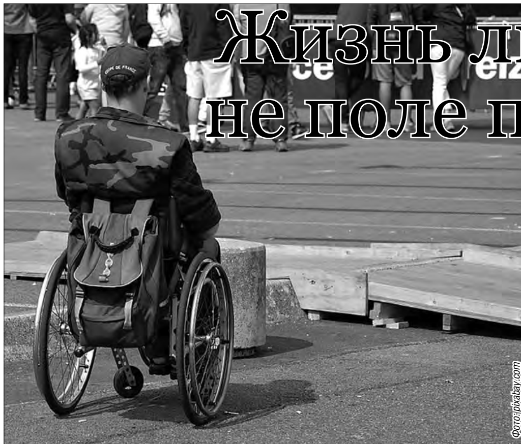
Как говорить о проблемах на которые нельзя закрыть глаза?

«Твой взгляд». В Магнитогорске открыт сезон заявок всероссийского конкурса