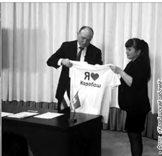
Фотоземель «Карабашский рабочий»

В Карабаше поговорили об экологии и не только