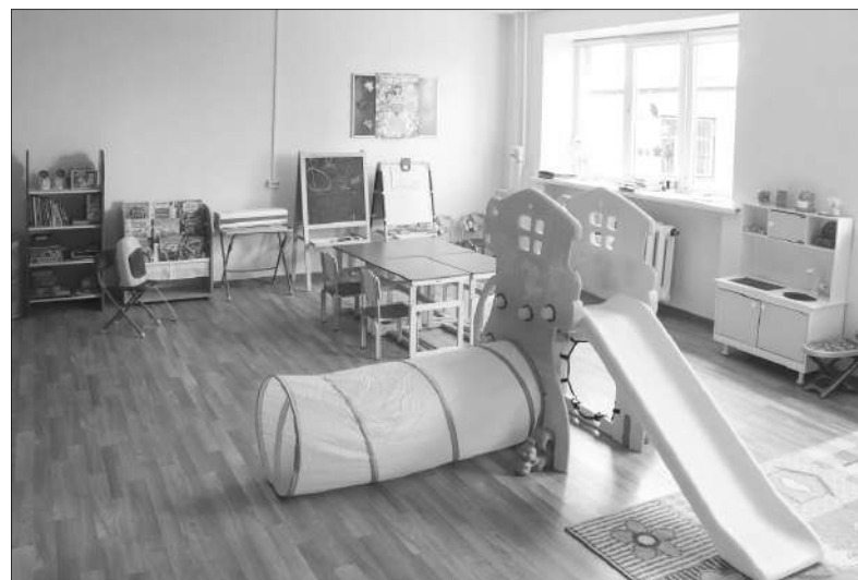
Об АНО «Магнитогорский дом для мамы» «МР» рассказывал уже не раз