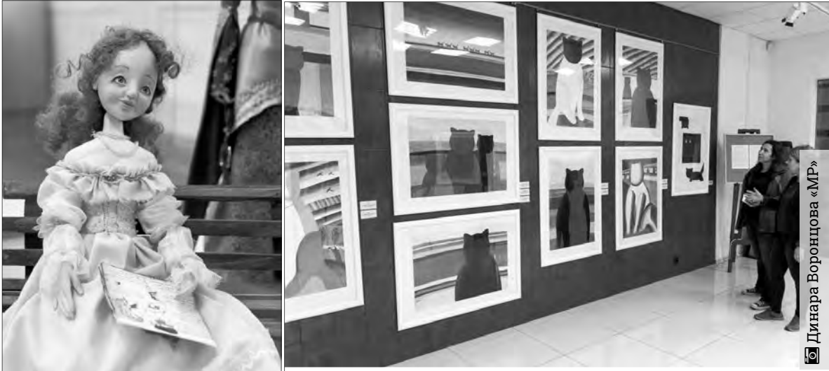
Динара Воронцова «МР»

В Магнитогорской картинной галерее открылись сразу две выставки,