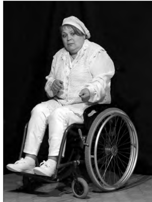
Актеры «Нон амплуа» Нина Сигорская и Алексей Роголин