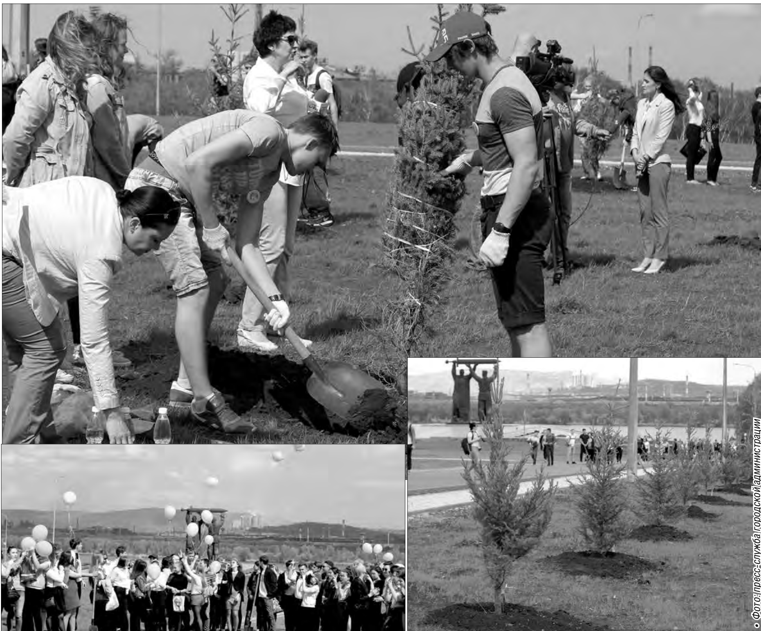
Фотослужба городской администрации

Участие в озеленении города – важный проект в процессе экологического образования детей