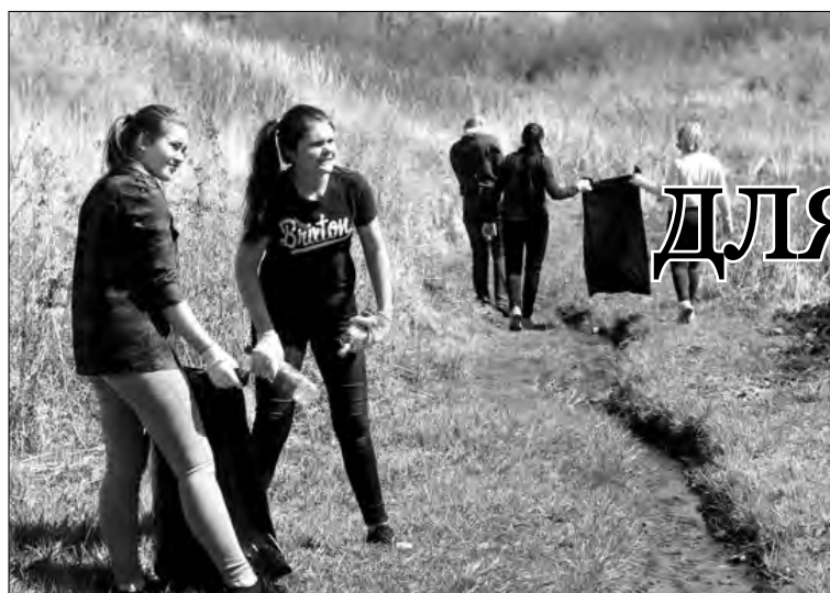
Источник – под надёжной защитой