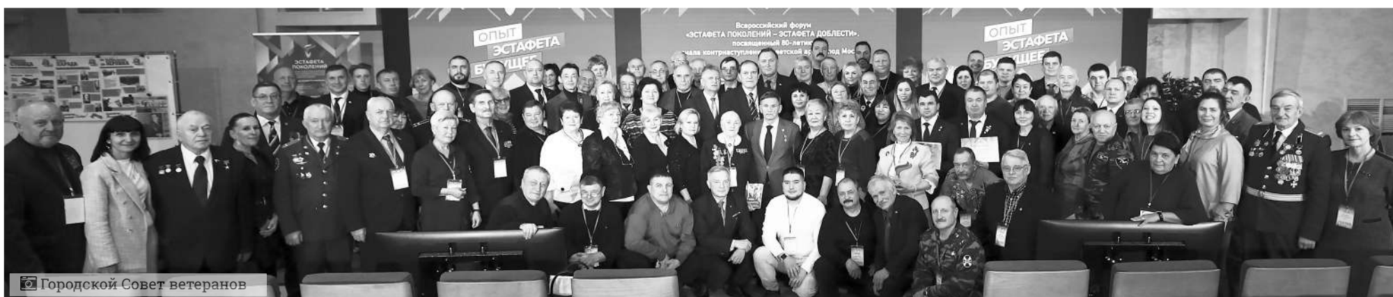
Городской Совет ветеранов

В течение пяти дней более 140 участников из 60 регионов страны делились опытом работы по патриотическому воспитанию и вместе с экспертами изучали исторические, психологические, конспирологические аспекты этой деятельности.