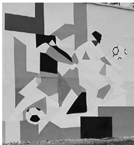
Рисунок появился в рамках реализации программы «Пять шагов благоустройства повседневности». Ее цель – создание современной городской среды. Проекты программы разделены по тематикам, каждая из которых представляет собой один из пяти шагов. «Паблик-арт с вовлечением жителей» – шаг №3.

Городская среда. В 144-м микрорайоне около МОУ СОШ №1 завершены работы по нанесению стрит-арта на здание бойлерной МП трест «Теплофикация»