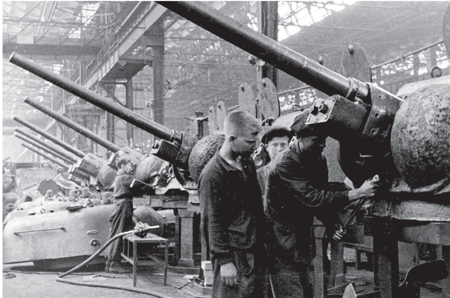
Сборочный цех Кировского завода, фонды ОГАЧО / фото: ОТКРЫТЫЕ ИСТОЧНИКИ, АРХИВЫ МИКМ И «МР»

Истории строки. 11 марта исполнилось 80 лет со дня создания Уральского Добровольческого танкового корпуса