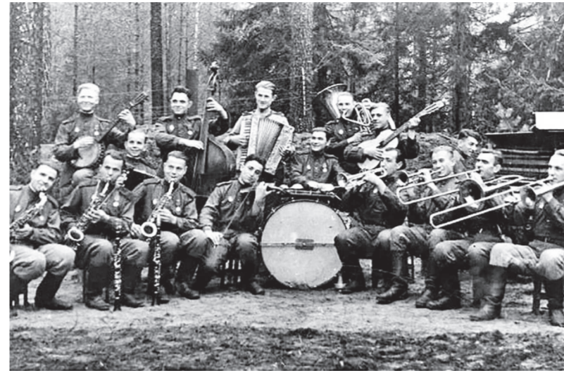
Джаз-оркестр УДТК /

«Рабочие Златоуста, изготавливая для добровольцев ножи в черных ножнах, думали лишь о том, чтобы облегчить войнам фронтовой быт. Но враг, изведав силу наших ударов, в первых же боях заговорил об армии с черными ножами (шварц