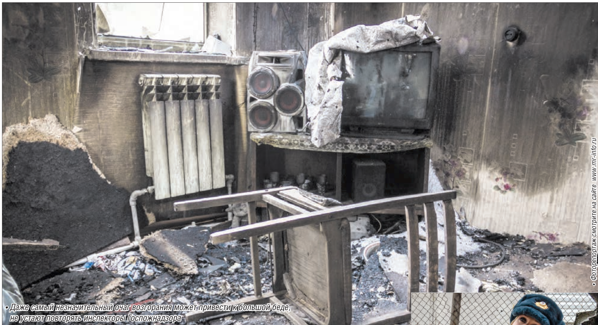
• Даже самый незначительный очаг возгорания может привести к большой беде, не устают повторять инспекторы Госпожнадзора

В начале весны пожарные инспекторы традиционно наведываются в гости к садоводам