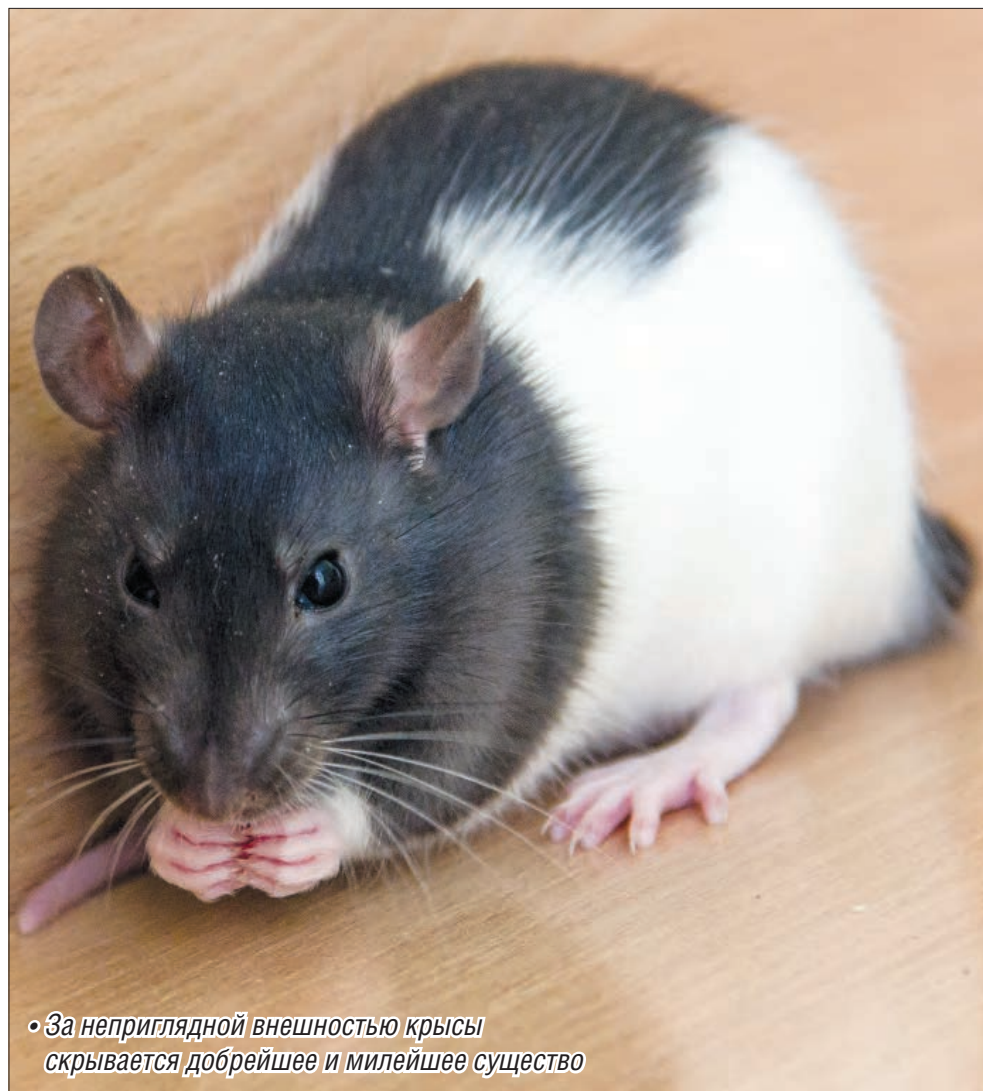
• За неприглядной внешностью крысы скрывается добрейшее и милейшее существо

К сожалению, Нюся не прожила у меня долго. Крысы обладают многими достоинствами, но главный их недостаток – очень короткая жизнь. После Нюси мы завели ко-