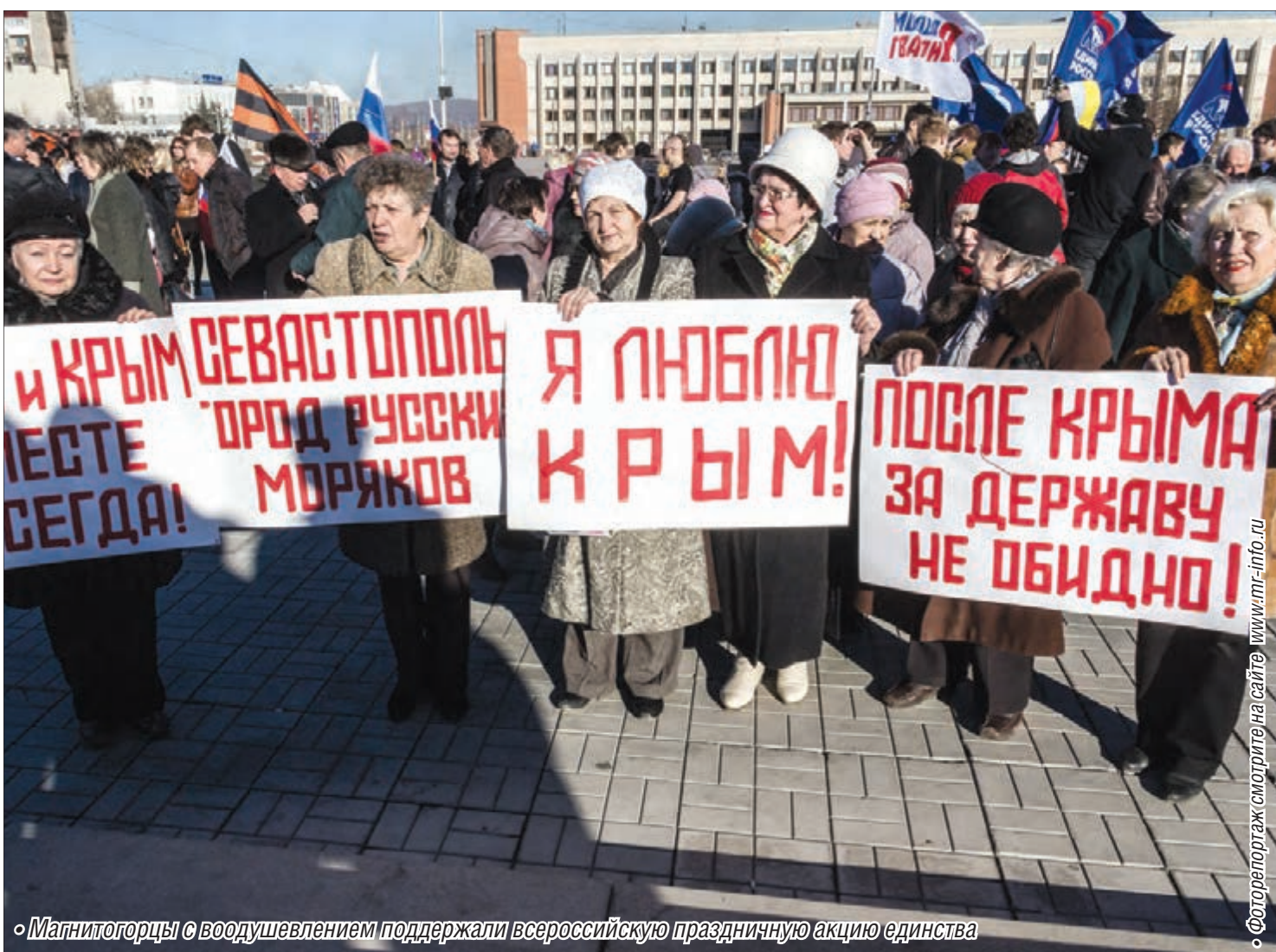
Магнитогорцы с воодушевлением поддержали всероссийскую праздничную акцию единства

Жители Магнитогорска приняли участие в праздничном митинге, посвящённом годовщине присоединения к России новых территорий