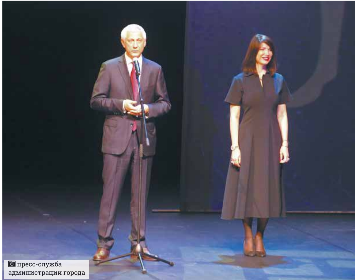
пресс-служба администрации города

– Я счастлива быть здесь, на церемонии подведения итогов фестиваля «Сцена-2021», – отметила Ирина Николаевна. – Я рада, что фестиваль в этом году состоялся. Одиннадцать дней назад мы открывали его в Челябинском театре драмы имени Наума Орлова, а закрываем в Магнитогорском драматическом театре имени Пушкина, в котором я впервые нахожусь. Я не могу не сказать с этой сцены о своих впечатлениях от этого прекрасного здания, театра, который действительно стал храмом Мельпомены и дарит свое