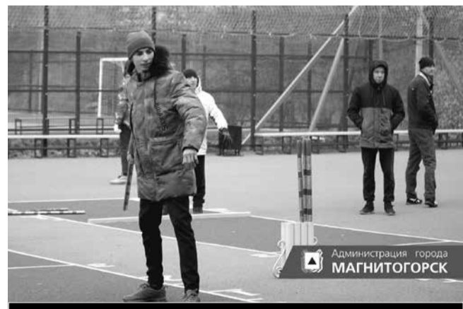
Администрация города МАГНИТОГОРСК

Отметим, что площадка открыта не только для спортсменов, но для всех, кто хочет научиться этому виду спорта.