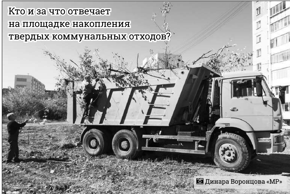
Динара Воронцова «МР»

обслуживают жилой сектор, мусор с которого складывается на контейнерных площадках.