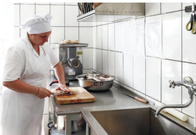
▶ мы стараемся готовить вкусно и полезно