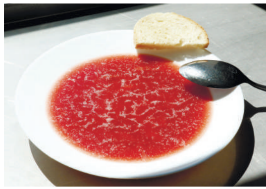
▶ главное в кулинарии – вкладывать душу, чтобы вкусно было