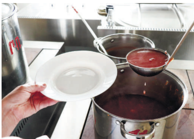
▶ есть дети, которые рыбу обожают. А есть те, кто хлеб едят с компотом