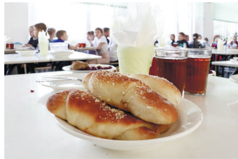
▶ «какова еда – такова и хода»

В детском саду 200 детей, к зиме планируется полная загрузка – 360. На завтраки детки охот-