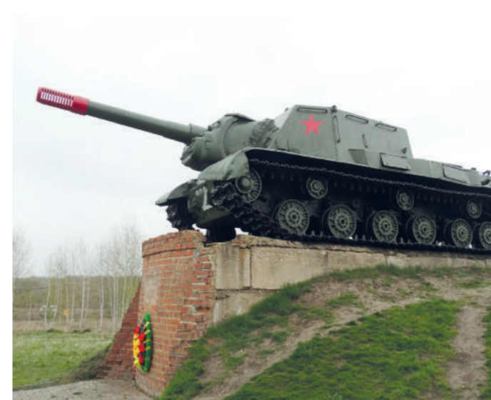
Самоходная установка, установленная на постаменте в память о танкистах 96-й бригады /