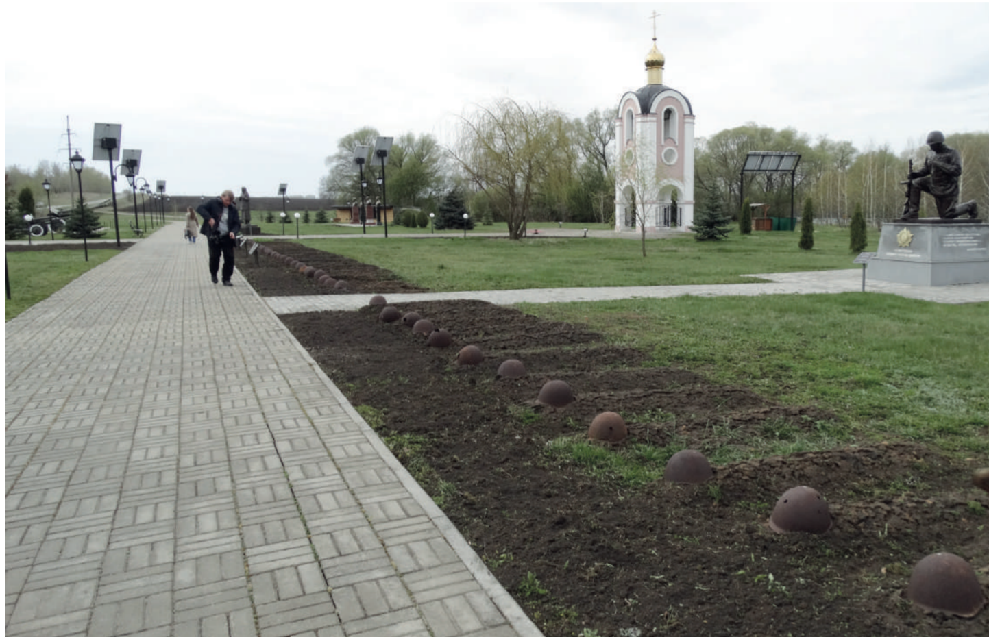
На мемориале «Тербунский рубеж»