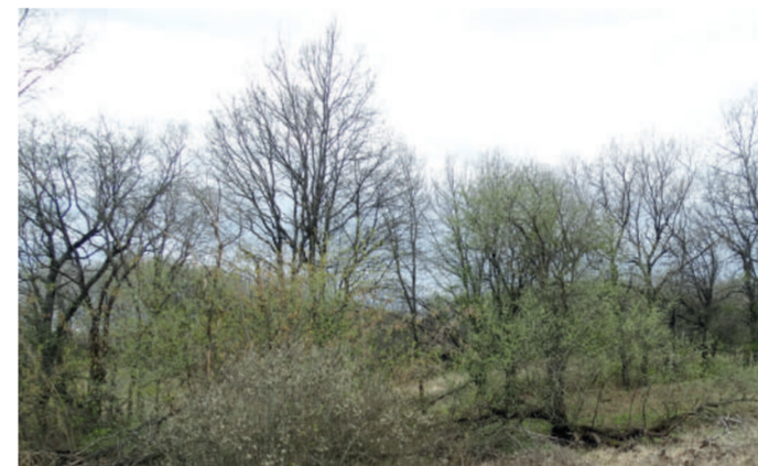
У Бординской рощи /