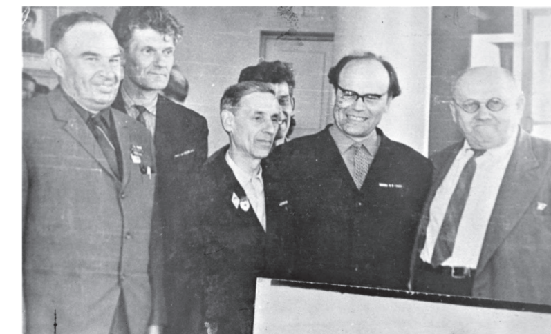
Ветераны 96-й танковой бригады

Для жителей Тербунского района 96-я танковая бригада имени Челябинского комсомола стала символом мощи Красной армии. Здесь начался героический путь наших земляков, который через Курскую дугу, Белгород, Харьков, Молдавию, Румынию привел их в Болгарию, где они встретили Великую Победу. Много славных страниц было в боевой биогра-