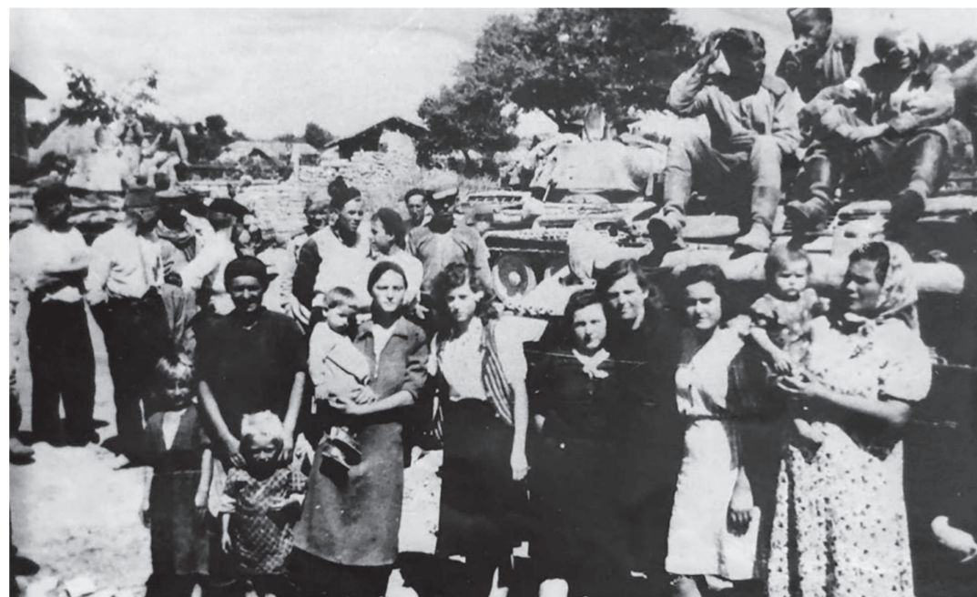
Освобождение от немцев с. Врбница в Болгарии. Жители села встречают танкистов 96-й танковой бригады, 1944 г./