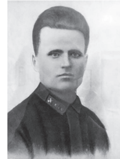
Вениамин Ефимович Киселев /