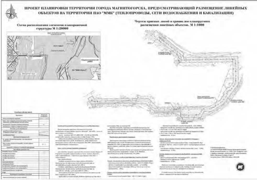
Приложение к постановлению администрации города от 16.05.2019 №5635-П