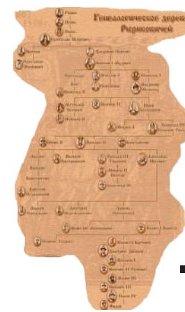
Древо Юриковичей — https://дом-родословия.рф