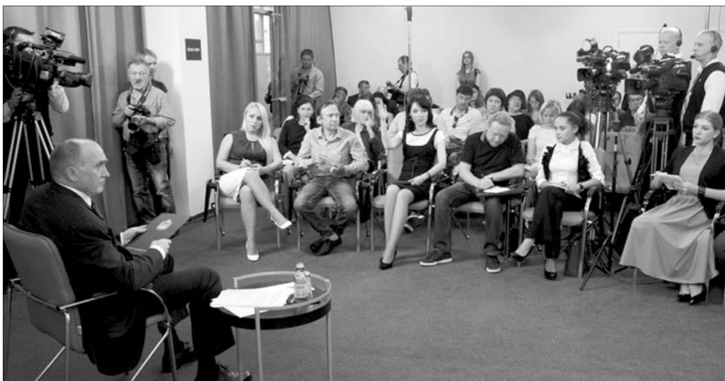
Встречи губернатора с журналистами носят доверительный характер