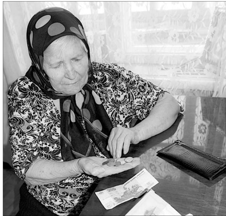
Главное – спланировать семейный бюджет