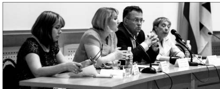
Важно обучить тех, кто активно работает с населением