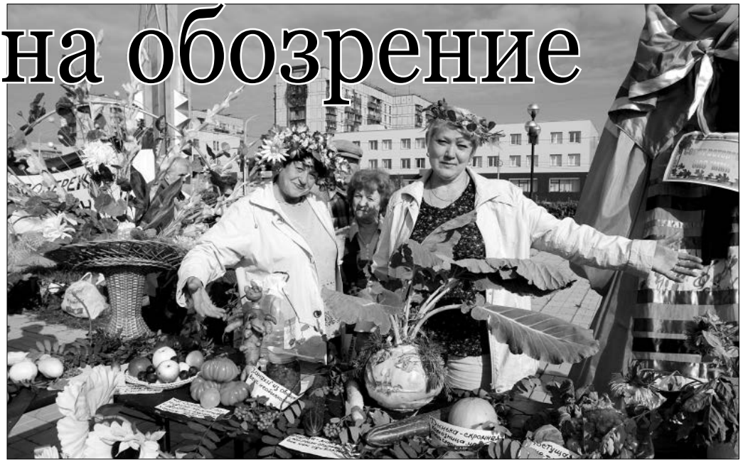
Выставка «Дары садов» проводится с 2005 года

Выставка «Дары садов» проводится в Магнитогорске с 2005 года. За это время ее участниками стали несколько тысяч человек. Только в прошлом году в итоговом мероприятии приняли участие около двухсот магнитогорцев из пятидесяти разных представительств, тридцать шесть из которых — ветеранские организации предприятий города. Тринадцать ветеранских организаций стали победителями в различных номинациях. Среди них ветераны ОАО «ММК-МЕТИЗ», ОАО трест «Магнитострой», советы ветеранов