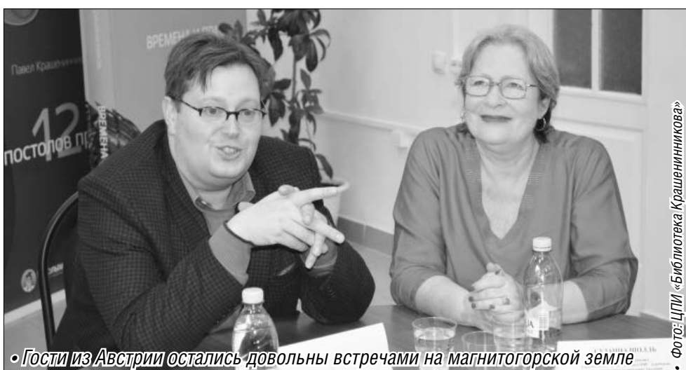
Гости из Австрии остались довольны встречами на магнитогорской земле

В Центре правовой информации «Библиотека Крашенинникова» прошла встреча с гостями из Австрии