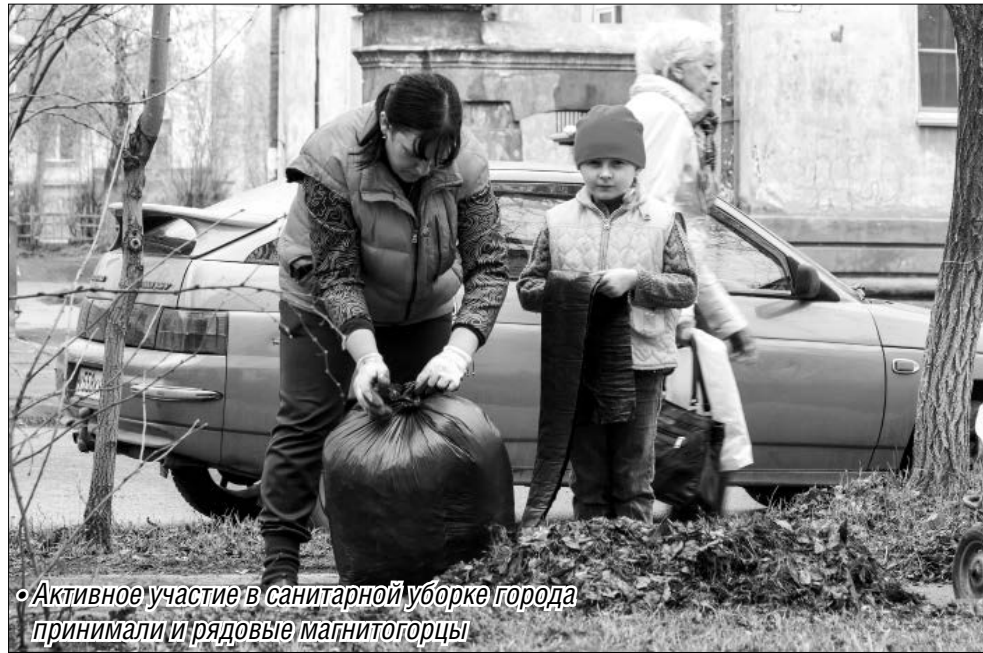
Активное участие в санитарной уборке города принимали и рядовые магнитогорцы

Управляющим компаниям дали ещё немного времени для уборки