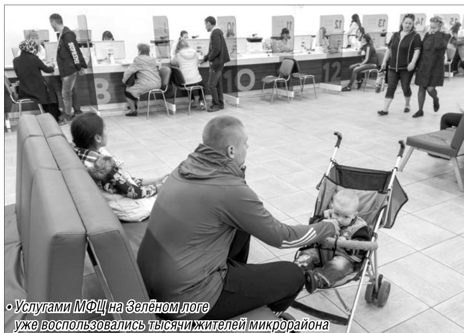
• Услугами МФЦ на Зелёном логге уже воспользовались тысячи жителей микрорайона