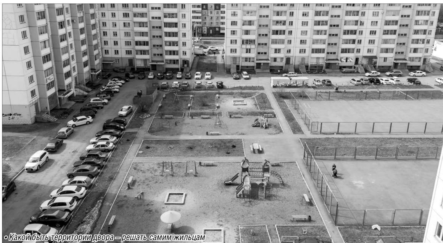
• Какой быть территории двора — решать самим жильцам

Горожане могут присоединиться к национальному проекту по созданию комфортной среды