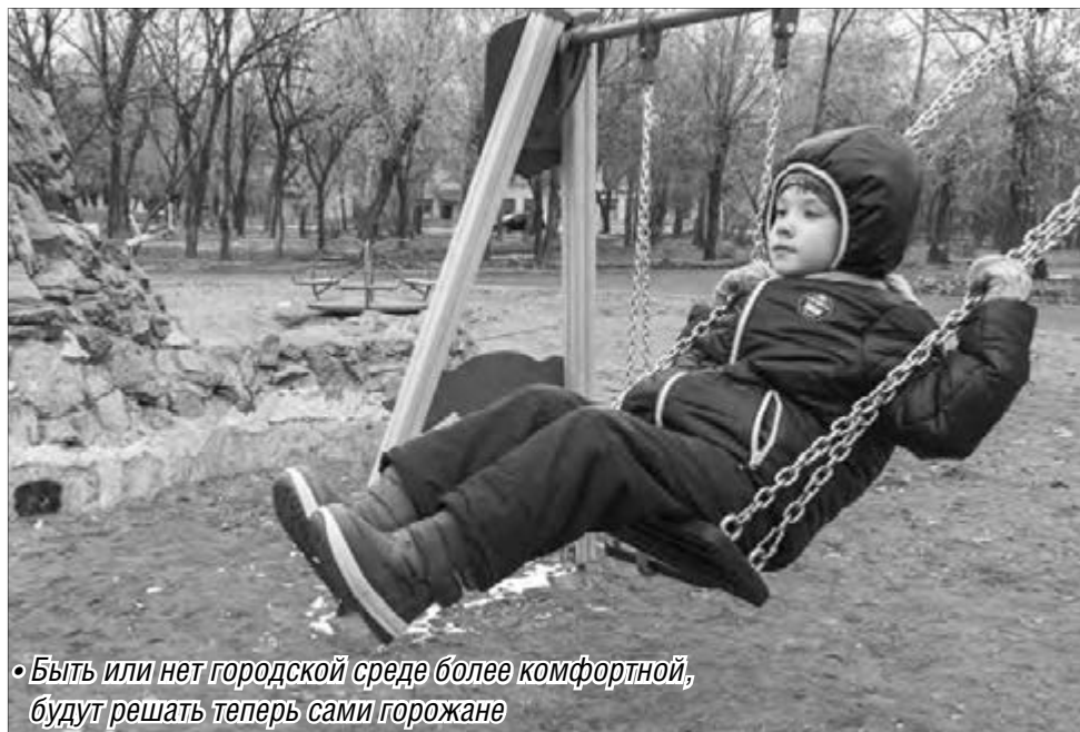
• Быть или нет городской среде более комфортной, будут решать теперь сами горожане

По условиям программы планируется проведение работ по благоустройству, включенных в два перечня. В малый перечень входят ремонт дворовых проездов, обе-