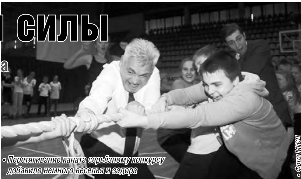
Перетягивание каната серьезному конкурсу добавило немного веселья и задора

Для создания праздничного настроения Дворец творчества детей и молодежи и студия NEXТ подготовили отличные танцевальные номера. Можно сказать, «Моя Магнитка» была одним из первых мероприятий,