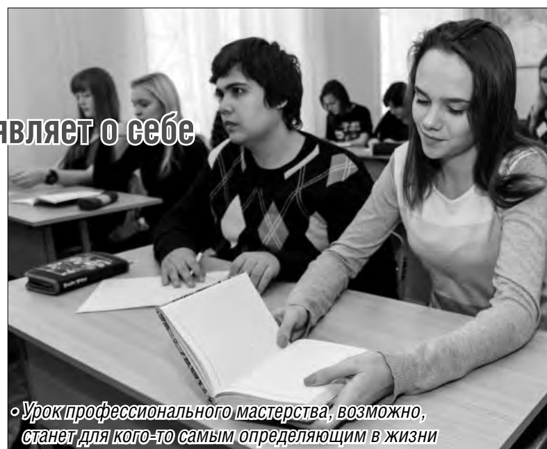
«Урок профессионального мастерства, возможно, станет для кого-то самым определяющим в жизни»

– Наша практика не ограничивалась проведением уроков и работой в летнем лагере. Мы даже проводили родительские собрания. И еще: современный учитель не только ведет уроки, но и зани-