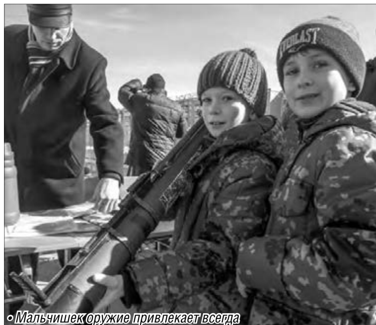
• Мальчишек оружие привлекает всегда

Подготовил Алексей ТЮПЛИН