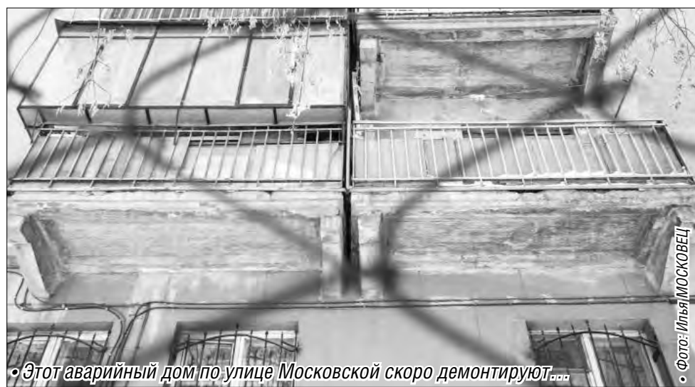
Этот аварийный дом по улице Московской скоро демонтируют...