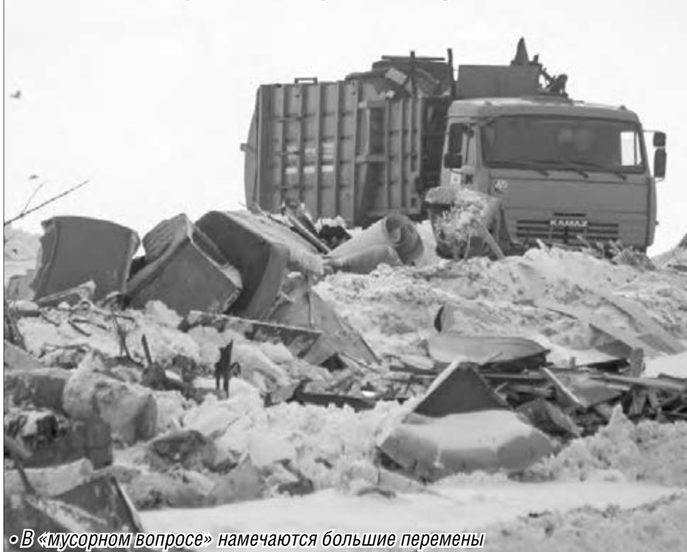
В «мусорном вопросе» намечаются большие перемены

В Магнитогорске построят современный полигон для мусорных отходов