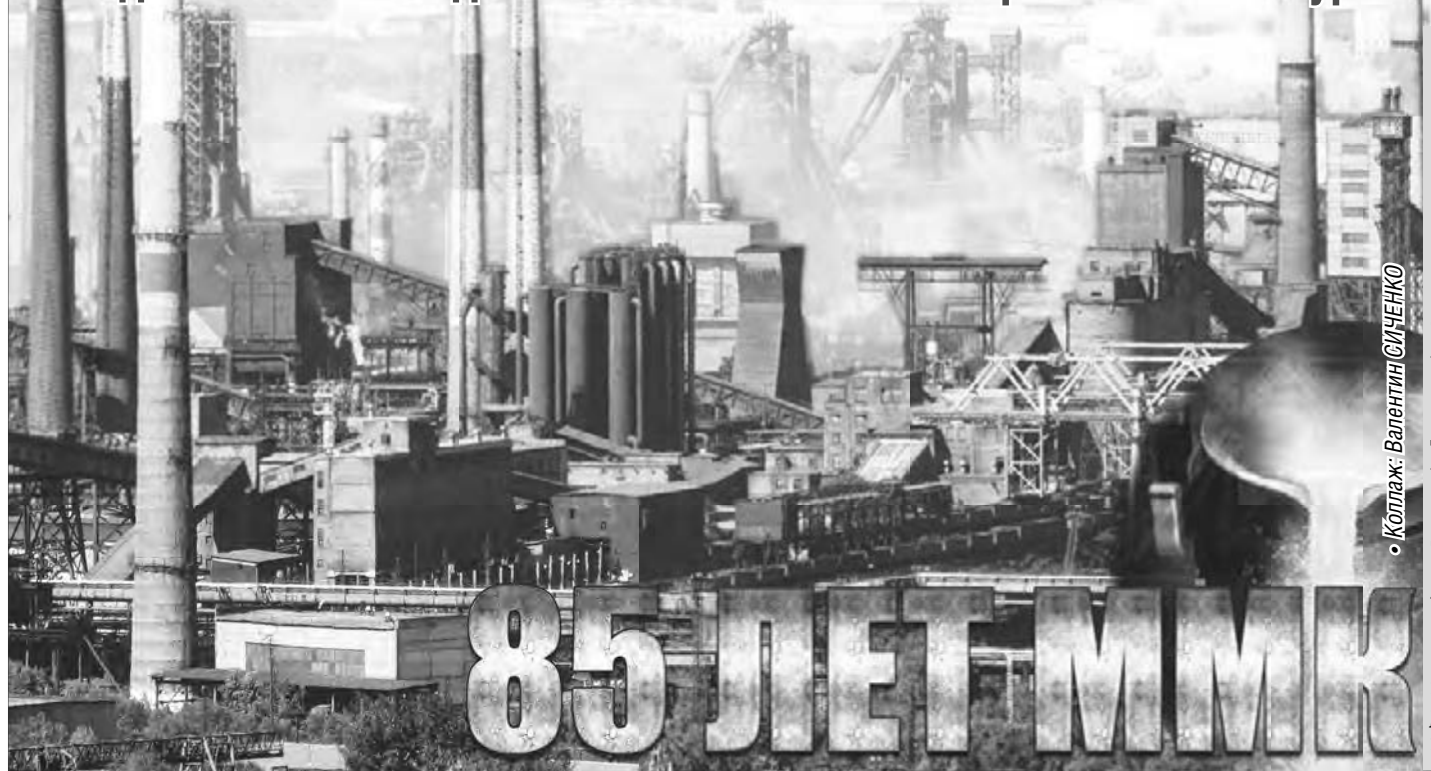
• Коллаж: Валентин СИЧЕНКО

Сегодня – 85 лет со дня основания Магнитогорского металлургического комбината