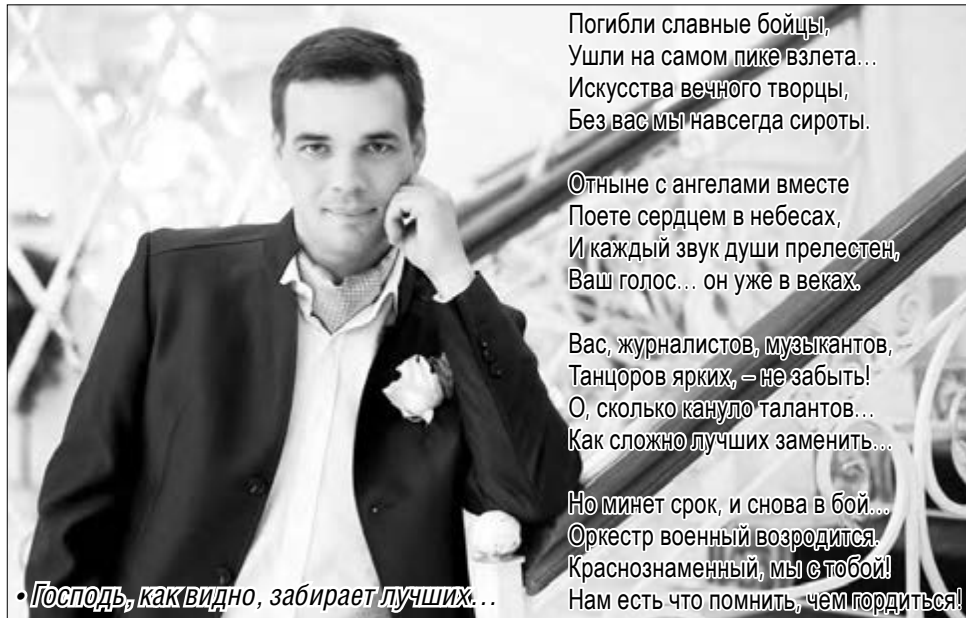
«Господь, как видно, забирает лучших...»