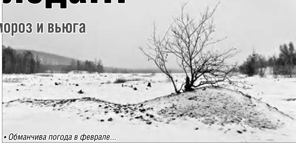
• Обманчива погода в феврале...

Климат у нас умеренно континентальный, характеризуется резкой сменой погоды, когда, кажется, в одночасье за теплом приходит холод. Так и в нынешнем январе резко похолодало, начались снегопад и метель. К счастью, в этом году дорожные службы быстро справились с сугробами. Однако морозные