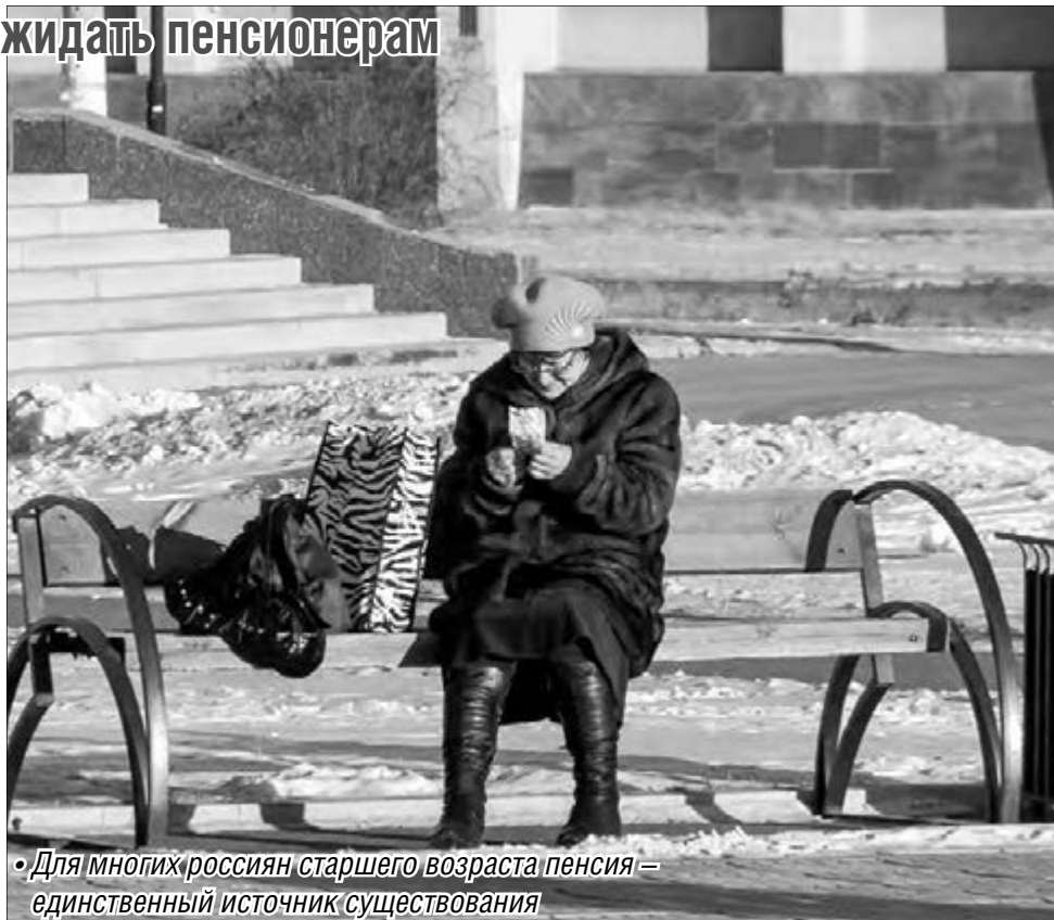
• Для многих россиян старшего возраста пенсия – единственный источник существования