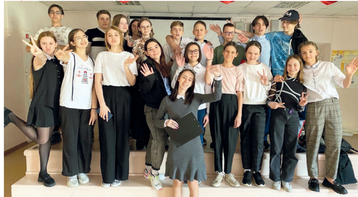
Ребята из школы №55 живут дружно и весело /

магнитогорских школах – для этого приобретена компьютерная техника.