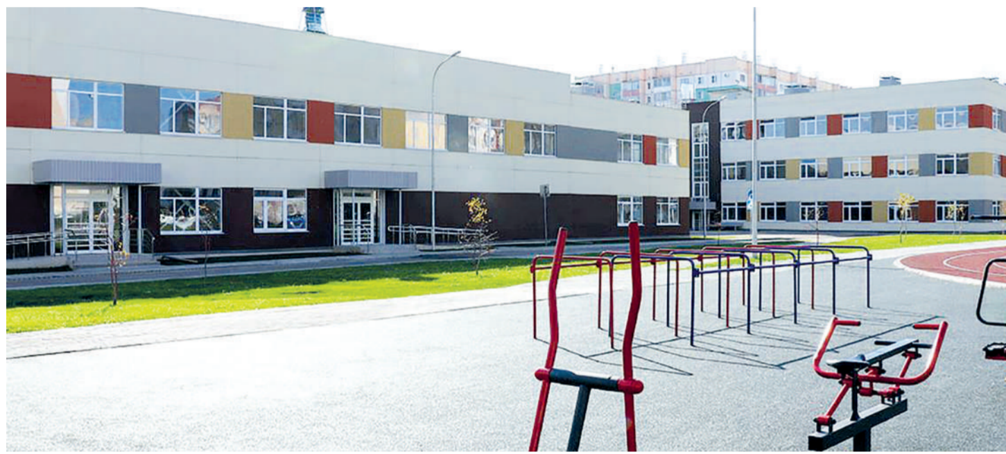
Новое школьное здание – отделение школы №47

Нацпроект «Образование». В Магнитогорске благодаря федеральной программе открываются новые школы, обновлена материально-техническая база учреждений, обучение и воспитание выходят на новый уровень