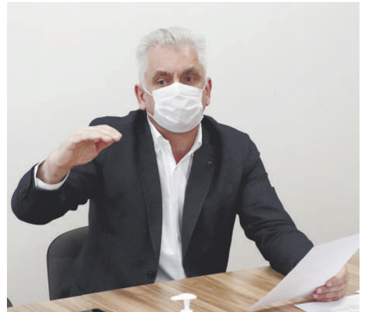
Заседание общественной комиссии.