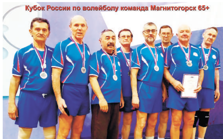
Кубок России по волейболу команда Магнитогорск 65+

Спорт. В подмосковном Раменском прошли игры Кубка России по волейболу среди ветеранов категории «65 плюс»