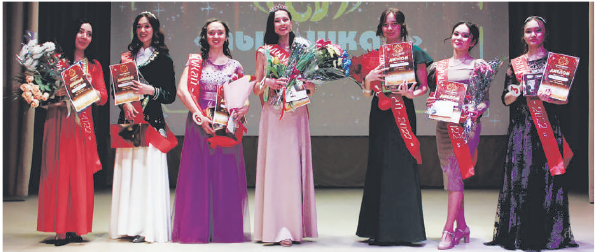
Весенний конкурс.

Настоящее шоу состоялось в этот день на сцене Дома дружбы народов. Красивые, позитивные, активные девушки все конкурсные задания выполняли на высочайшем уровне. Было пять массовых выходов – презентация, танцевальный флешмоб «Спортивные танцы», показ современной моды, дефиле в башкирских костюмах и в вечерних платьях. Столь же успешно участницы продемонстрировали свои таланты в конкурсе художественной самодеятельности – показали башкирские сольные танцы, спели песни, прочитали стихотворения, а Флорида МАР-