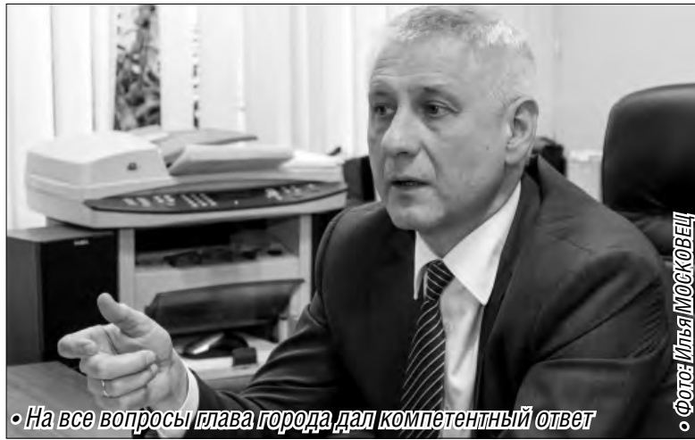
• На все вопросы глава города дал компетентный ответ

И, действительно, диалог получился. Ребята основательно подготовились к встрече с главой города, про-