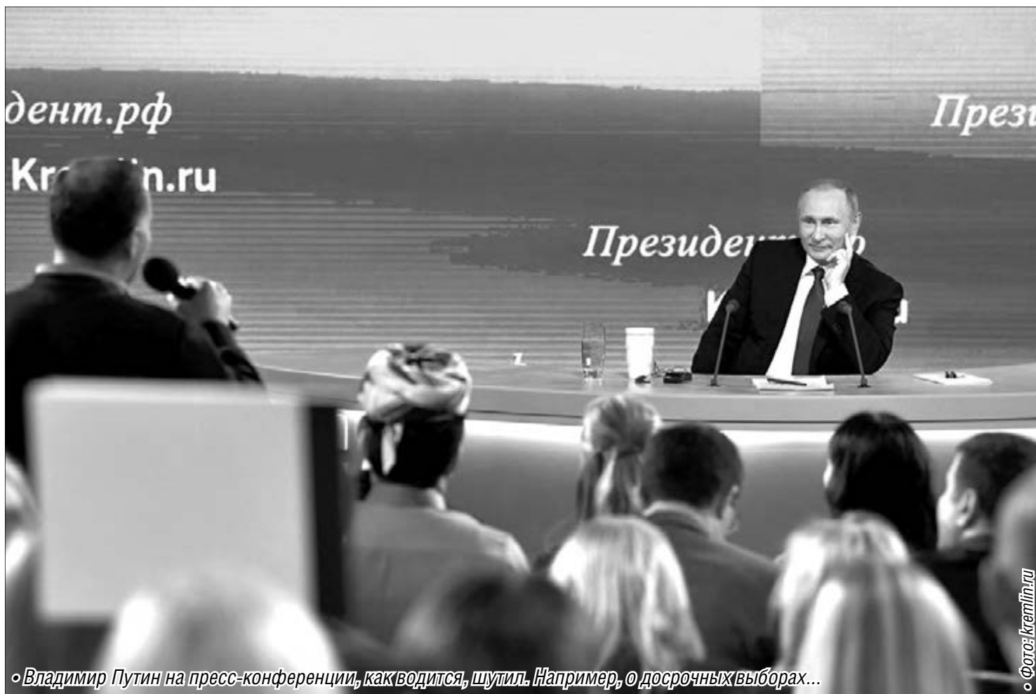
◦ Владимир Путин на пресс-конференции, как водится, шутил. Например, о досрочных выборах...

Итоговая пресс-конференция Президента РФ Владимира Путина состоялась вчера в центре международной торговли в Москве