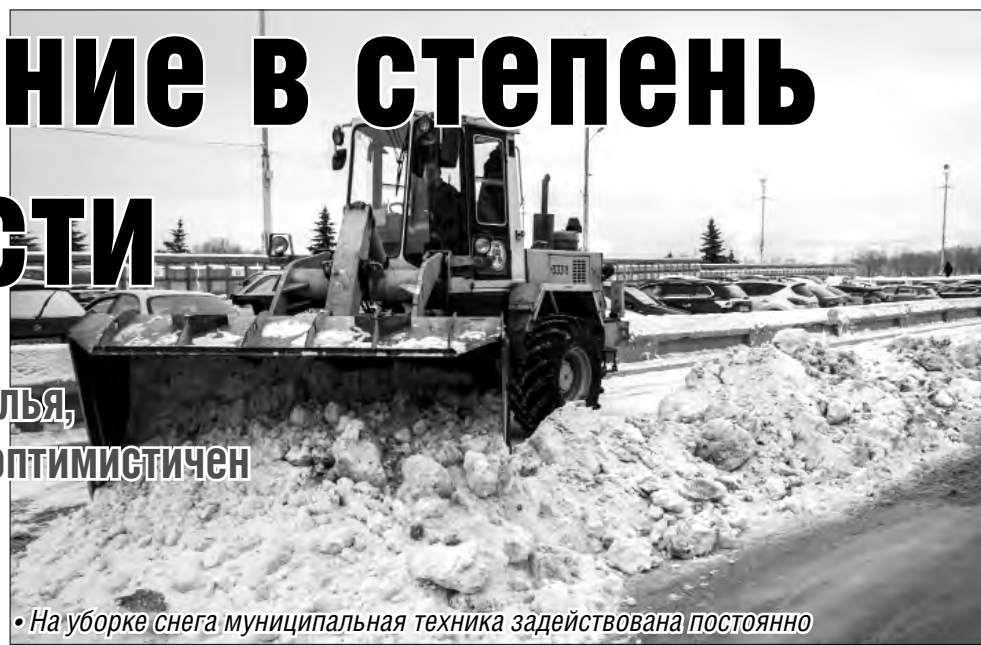
• На уборке снега муниципальная техника задействована постоянно

По информации, полученной от застройщиков, в будущем году планируется ввод в