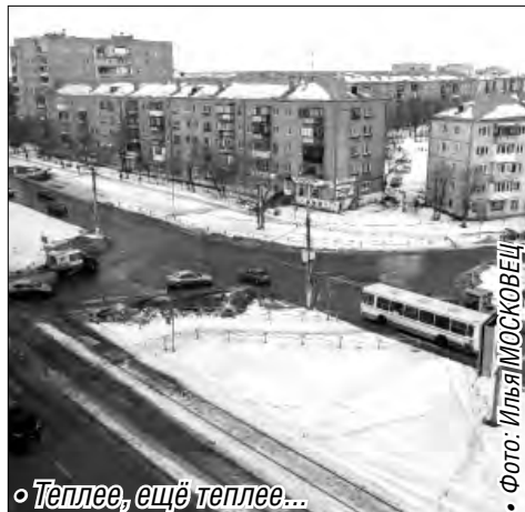
• Теплее, ещё теплее...

Сегодня дневные и ночные температуры должны сравняться, достигнув минус 15 градусов. Зато ветер усилится до двух-трех метров в секунду, порывы будут достигать восьми метров в секунду. К началу следующей недели ветер успокоится. Днем будет минус 14-16 градусов, ночью холоднее. В конце недели температура достигнет климатических значений: 28-31 декабря ожидается ночью 16-21 градус мороза, днем 10-15 градусов ниже нуля, информирует гидрометслужба Урала.