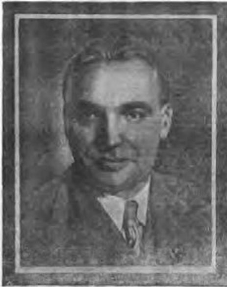
Валерий Павлович Чкалов На фото Валерий Чкалов – лётчик, совершивший перелёт через полюс в Америку.

Правительственное сообщение Правительство Союза ССР с глубоким при- скорбием извещает о гибели великого лётчи- ка нашего времени, Героя Советского Союза тов. Валерия Павловича ЧКАЛОВА при испытании нового самолета 15 декабря сего года.