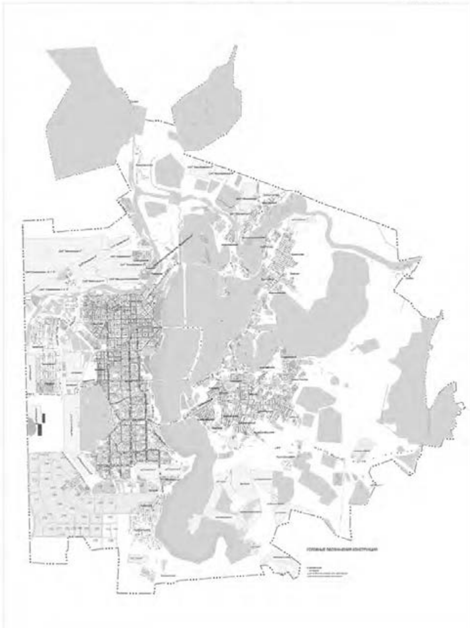
КАРТА РАЗМЕЩЕНИЯ РЕКЛАМНЫХ КОНСТРУКЦИЙ на территории города Магнитогорска