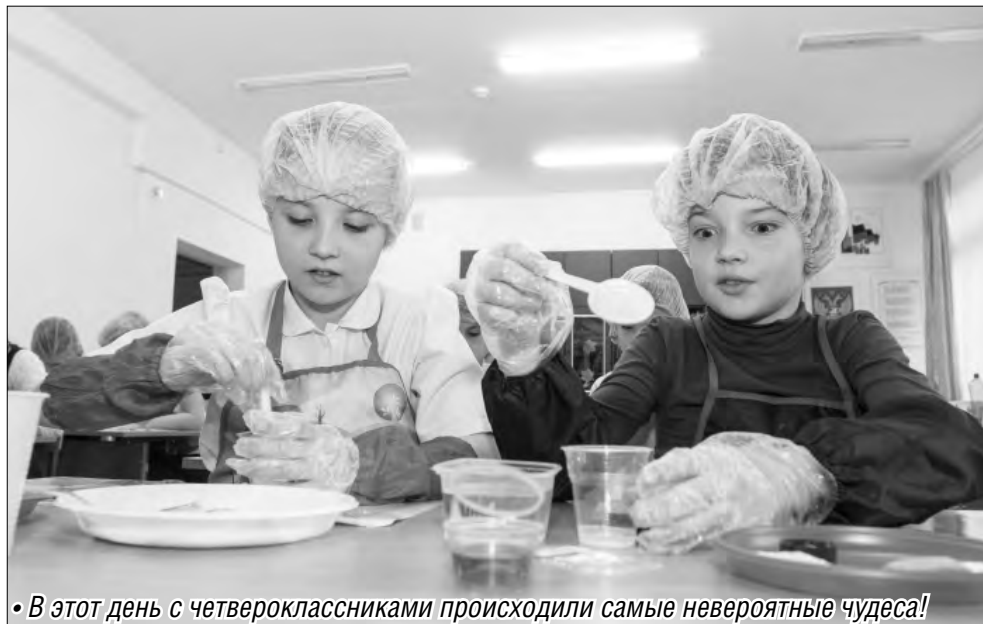
• В этот день с четвероклассниками происходили самые невероятные чудеса!

– Нас заинтересовал опыт образовательного центра «Сириус» в Сочи, созданного по инициативе президента РФ. Одна из целей