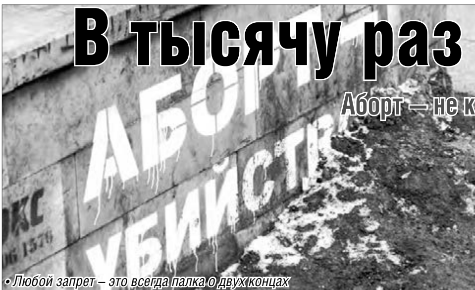
• Любой запрет — это всегда палка о двух концах