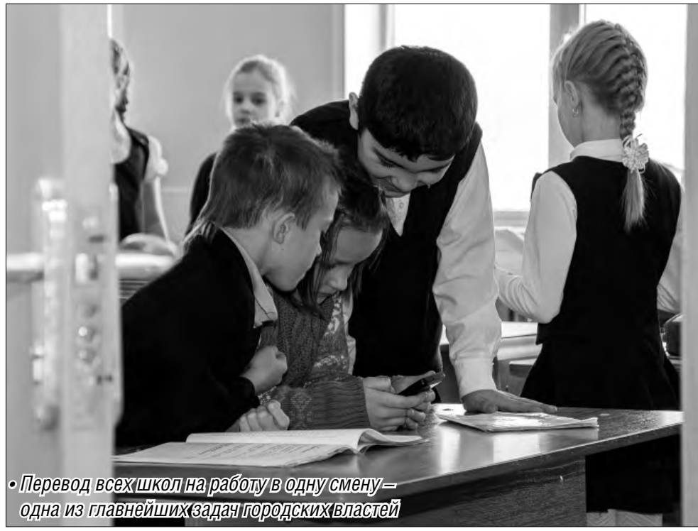
• Перевод всех школ на работу в одну смену – одна из главных задач городских властей

А вот указания главы государства, касающиеся заработной платы, в Магнитогорске