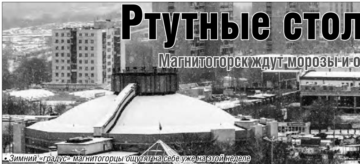
• Зимний «градус» магнитогорцы ощутят на себе уже на этой неделе

Магнитогорск ждет морозы и очень высокое атмосферное давление