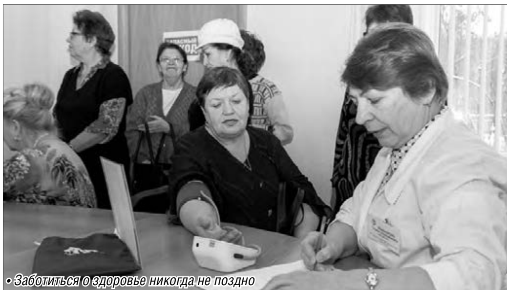
• Заботиться о здоровье никогда не поздно

Обязательна для людей любого возраста, особенно тех, кто вступает в полосу зрелости, ежедневная мозговая гимнастика: решение кроссвордов, освоение возможностей компьютера и Интернета, даже подсчеты стоимости коммунальных услуг. Чтобы вести здоровый образ жизни, важно отказаться от вредных привычек.