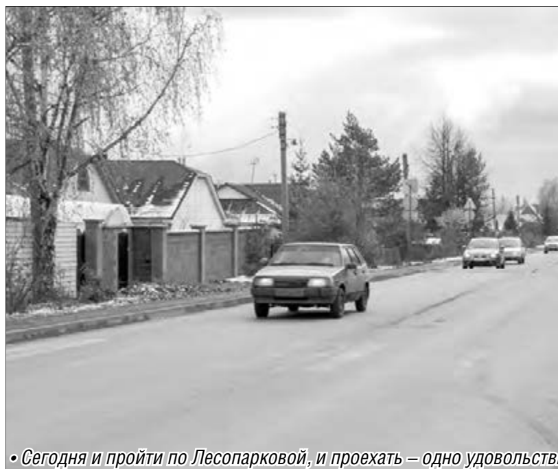
• Сегодня и пройти по Лесопарковой, и проехать – одно удовольствие!