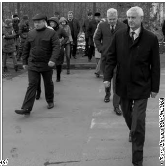
• Фото: Динара ВОРОНЦОВА

нитогорскинвестстрой». Подрядчик – ООО «Башспецстройматериалы». Средства на строительно-монтажные работы в размере 43 миллионов рублей были выделены из бюджета Челябинской области. В целом новая дорога получила одобрение местных жителей, которые не преминули высказать свое мн-