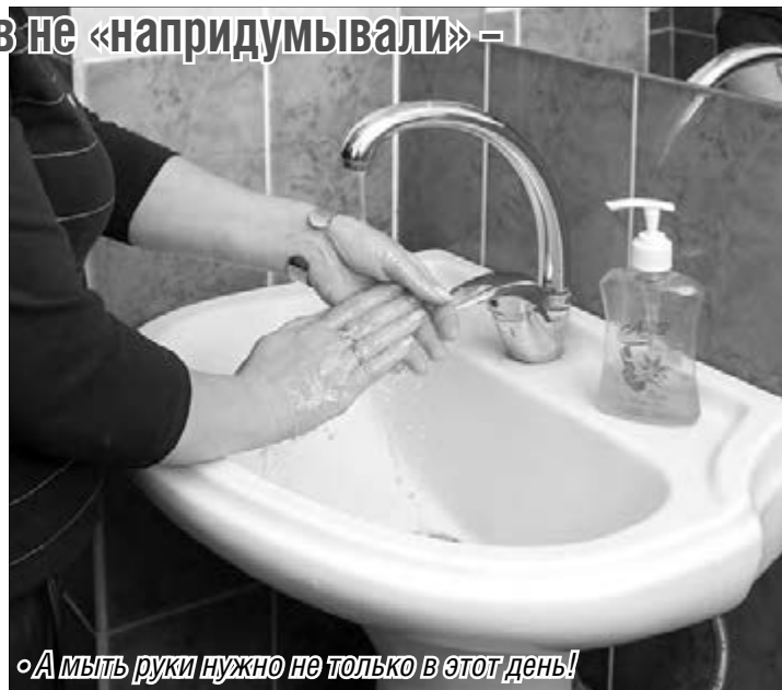
«А мыть руки нужно не только в этот день!»

Самых странных, причудливых и непонятных праздников накопилось целая прорва. И у каждого свои резоны, свои обоснования и своя история. Среди массы прочих – День рождения соломинки для коктейлей, Международный день «спасибо», Всемирный день объятий, Международный день без Интернета. В первый день первого весеннего месяца по стихийно сложившейся традиции в