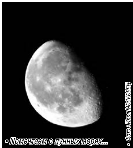
«Помечтаем о лунных морях...»

По данным Гисметео, в ночь на 16 октября полная Луна первый раз в этом году приблизится к Земле на минимальное расстояние, благодаря чему ночное светило предстанет необычайно ярким и большим. Контуры его рельефа будут заметны невооруженным глазом, а через бинокль можно будет разглядеть даже кратеры и лунные моря. Обычно суперлунием называют полнолуние, совпадающее с нахождением Луны в перигее, ближайшей к нам точке ее орбиты. Предстоящее суперлуние станет первым в этом году. Следующее ожидается 14 ноября, а последнее 14 декабря. Как подсчитали астрономы, периодичность события в среднем составляет 144 дня. Особого влияния на Землю оно не оказывает, однако усиливает приливы.