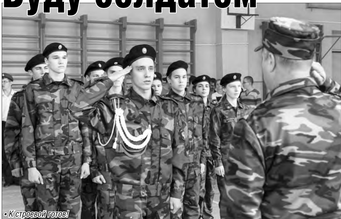
• К строевой готов!

Магнитогорские школьники отметили День призывника